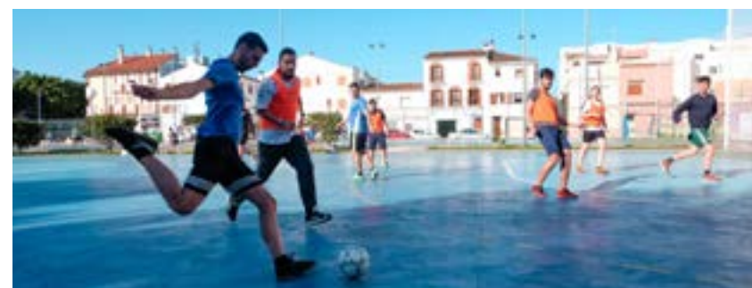
Fútbol sala masculino