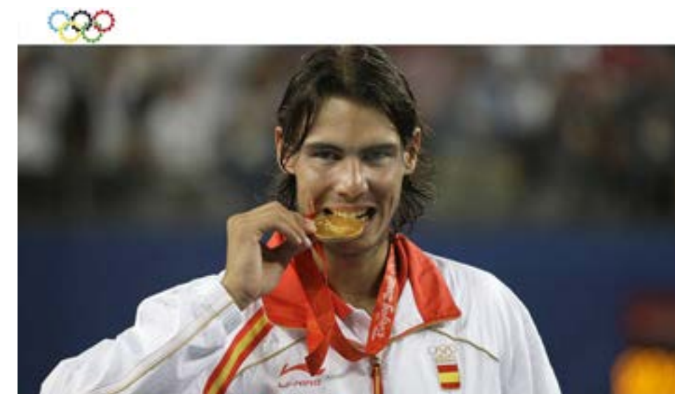
Esperit de lluita Rafa Nadal : "Sense patiment, no hi ha felicitat"