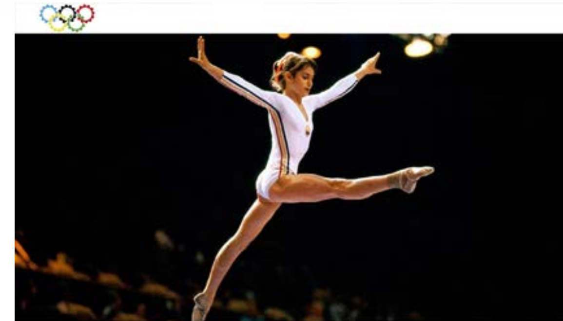
Perfecció El 10 de Nadia Comaneci