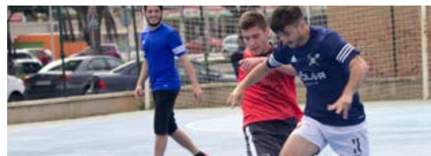
Futbol sala masculí

Avançat: dimarts i dijous de 20 a 21:30h