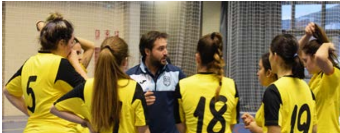
Fútbol sala femenino