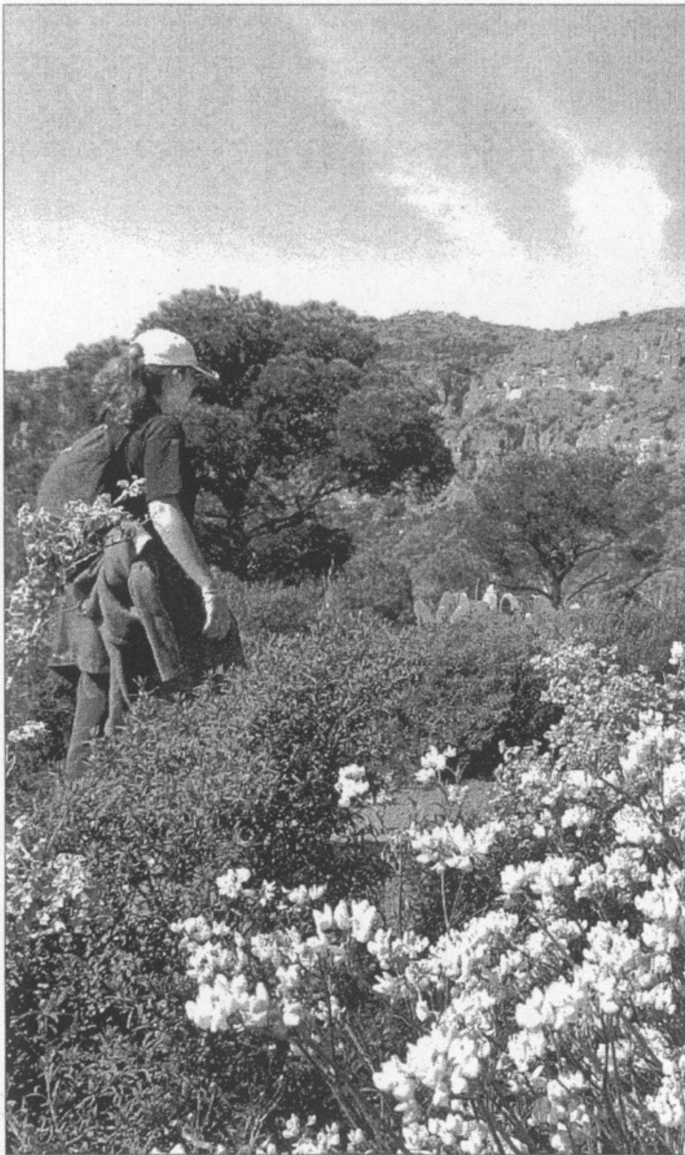
Una joven camina por un sendero de la sierra Calderona.

La ingobernabilidad del paraje natural está provocando que últimamente sean muchas las perso-