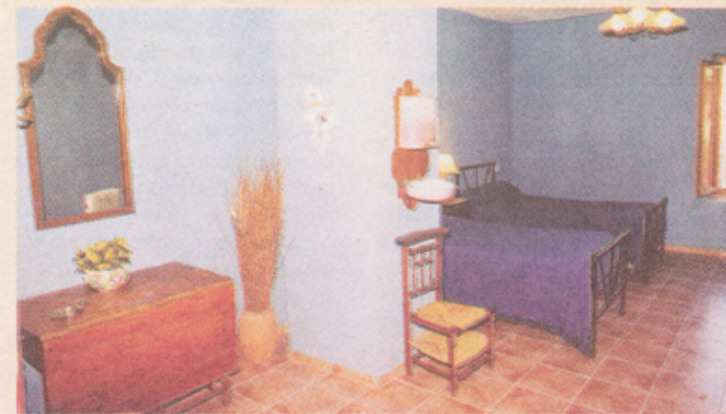
Vista de una habitación.

Si desea acudir a alguno de los restaurantes de la zona, tendrá la opción de disfrutar de algunos platos típicos, como el gazpacho de Mariola, la "olleta", "bajoques farcides", "pericana", "borreta", repostería tradicional (rollitos de almendra, "tonyes", etc. No hay que olvidar tampoco los magníficos embutidos artesanos, el acei-