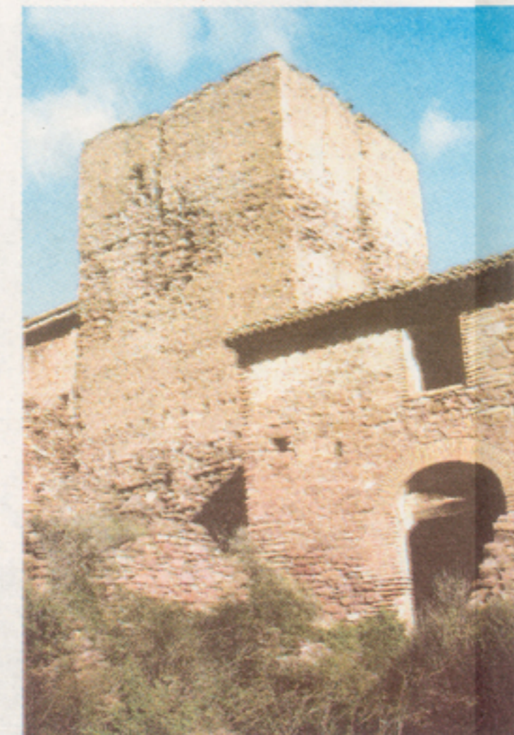
La Hoya de Olocau.

La sierra Calderona es el conjunto de montañas que se encuentra más próximo a Valencia y su área metropolitana. Por lo tanto, es la zona montañosa más accesible a los ciudadanos, que en apenas media hora pueden trasladarse en automóvil desde el paseo marítimo de Valencia a la cumbre del Garbí, a casi 600 metros de altitud, y desde donde se contemplan espléndidas vistas panorámicas. Podemos considerar a la sierra Calderona como el gran pulmón verde de la ciudad de Valencia y de sus comarcas próximas (l'Horta, Camp de Túria y Camp de Morvedre), por lo que tiene lógica que des-