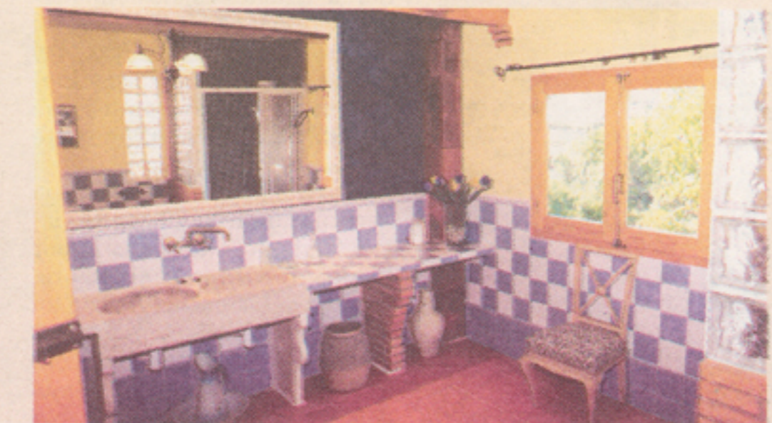
Uno de los baños. / ZLP