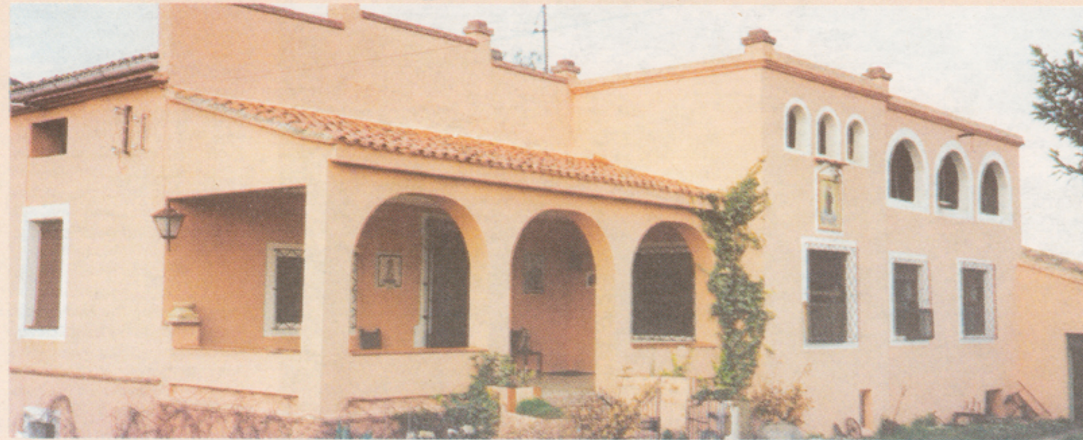
Fachada de la casa rural.

En Agres se encuentra la casa rural "Masía de San Joaquín", un interesante alojamiento turístico que se halla a los pies de la Sierra Mariola.