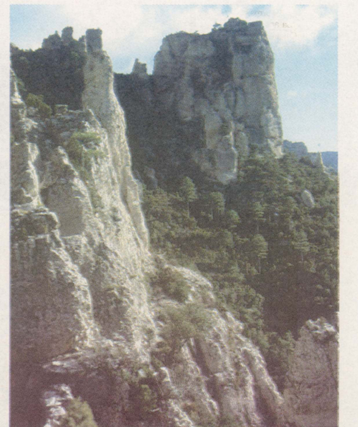
El Salt.

de Burjassot y pasa por Bétera, Náquera y Serra, concluyendo en Torres Torres, mientras que la CV-333 une Bétera con Olocau, Marines Viejo y Gátova. La CV-25 comunica Llíria con Marines, Olocau, Marines Viejo y Gátova, y la CV-245 enlaza Alcublas con Altura. La N-340 y la Autopista