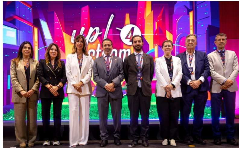
Clausura del Concurso Up! Steam4