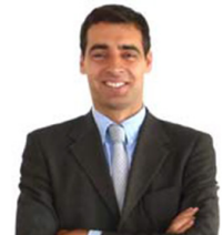
SECRETARIO DEL CONSEJO SOCIAL