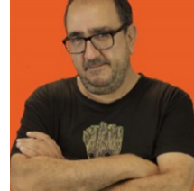
REPRESENTANTE NOMBRADO POR EL CONSEJO DE GOBIERNO DE LA UPV EN REPRESENTACIÓN DEL PERSONAL DE ADMINISTRACIÓN Y SERVICIOS