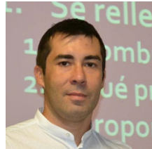
REPRESENTANTE NOMBRADO POR EL CONSEJO DE GOBIERNO DE LA UPV EN REPRESENTACIÓN DEL PERSONAL DOCENTE E INVESTIGADOR