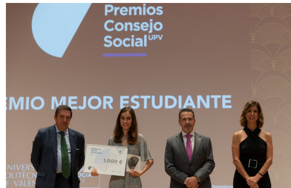
Gala de Entrega Premios Consejo Social 29 de junio