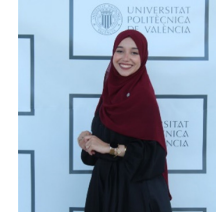
REPRESENTANTE NOMBRADO POR EL CONSEJO DE GOBIERNO DE LA UPV EN REPRESENTACIÓN DE LOS ALUMNOS y ALUMNAS