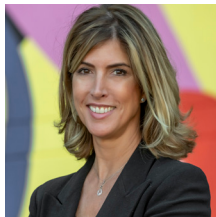
PRESIDENTA DEL CONSEJO SOCIAL