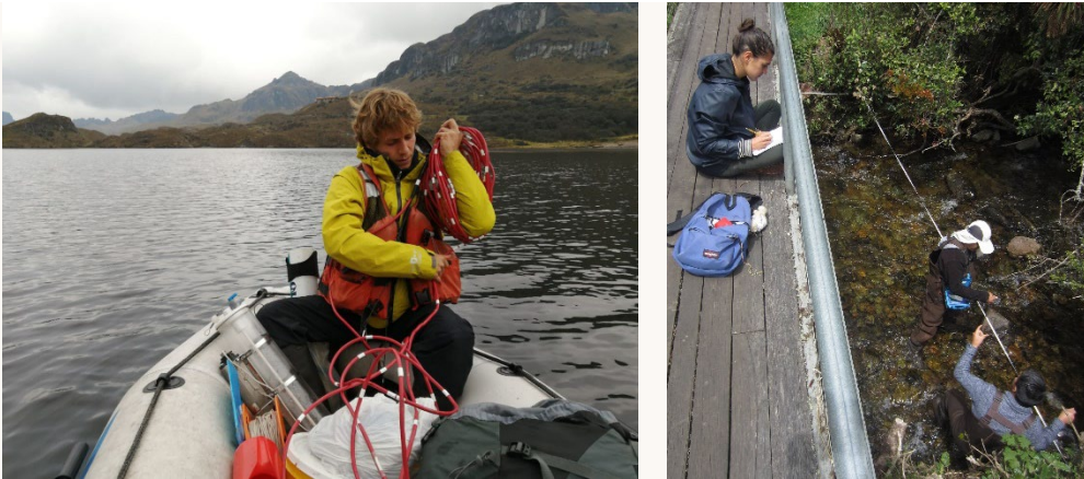
Figura 1: Ilustración de las actividades de campo y de laboratorio en las que han participado los becarios de MERIDIES durante sus estancias en el Laboratorio de Ecología Acuática (LEA) de la Universidad de Cuenca (UC).

Adicionalmente al entrenamiento técnico-científico asociado a los proyectos de investigación que el becario recibirá, éste tendrá además la posibilidad de contribuir a la preservación ambiental de los entornos en los que éstos se llevan a cabo y, por ende, al bienestar social para una gran población que se beneficia directamente de los múltiples recursos naturales que estos invaluables ecosistemas brindan.