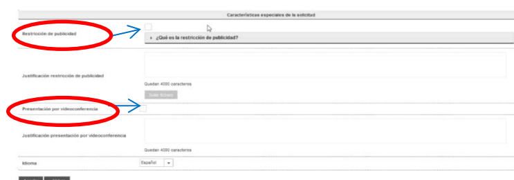
Restricción y videoconferencia

Solamente deberán marcar este check aquellos estudiantes que lo han solicitado previamente, y ha sido aceptado, en plazo (se recuerda que éste finaliza 7 días antes del inicio del plazo de solicitud de defensa).