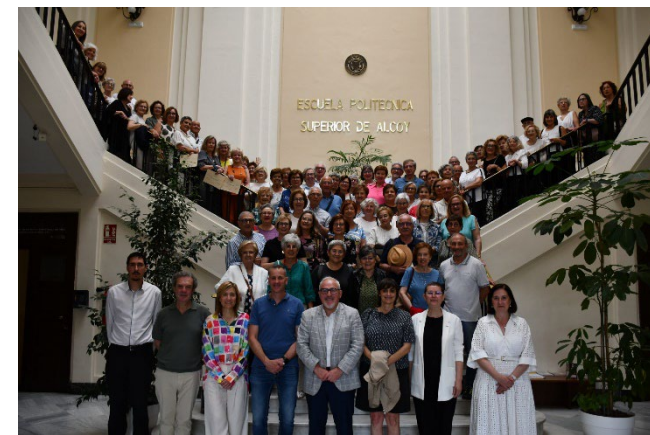
CLAUSURA CURS ACADÈMIC 2025-2026