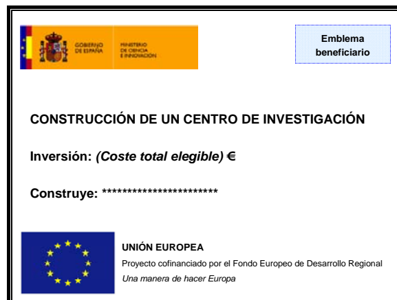
Figura 1: Ejemplo de cartel en obra de construcción

La siguiente figura muestra un ejemplo de cartel: