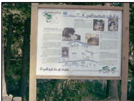
Los paneles de la zona nos indican las curiosidades y la historia del lugar. También nos señalizan las distintas zonas y las normas a respetar

En las proximidades del manantial, atravesando el puente, se encuentra cercado el tronco de olivo donde, San Vicente Ferrer predicó y realizó el milagro de hacer brotar un manantial de agua.