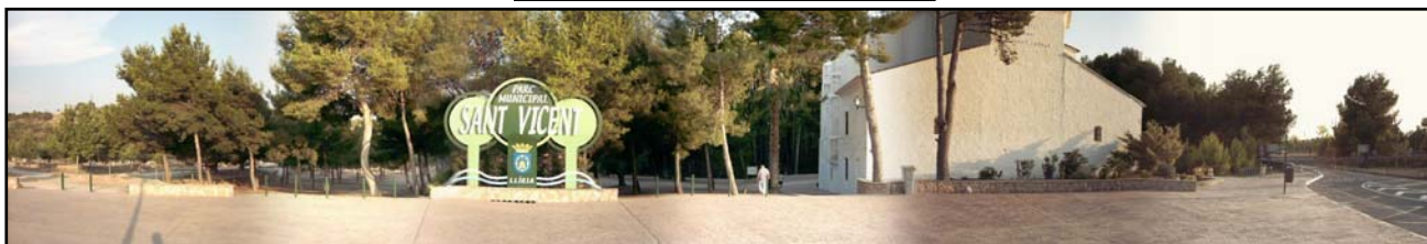
Panorámica de la entrada al paraje con el cartel de "Parc Municipal Sant Vicent", el edificio de al lado es la ermita