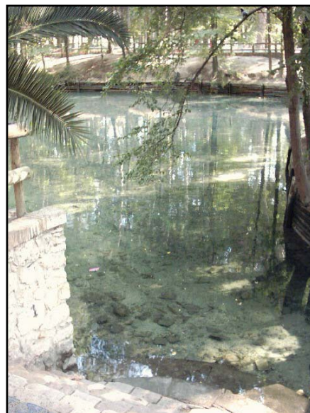
El agua es el elemento principal en todo el paraje

Este paraje natural, situado en torno al manantial ancestral conocido como " Font de Sant Vicent ", los romanos erigieron un templo dedicado a las ninfas (diosas del agua) y los cristianos construyeron la