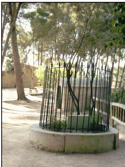
El olivo desde donde predicó San Vicente Ferrer y realizó el milagro

En la carretera que une las localidades de Liria y Olocau , aproximadamente en la mitad del camino se encuentra al paraje de San Vicente de Liria . Es un lugar muy visitado por los valencianos que disfrutan de sus fuentes, de los paelleros y de su exuberante vegetación, formada principalmente por pinos de gran porte y por algún que otro ciprés.