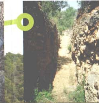
Paral·lela de comunicació