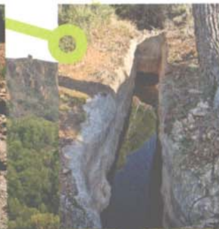
Bassa de refrigeració