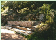
La Font de Potrillos

Cuentan las gentes del lugar, que recuerdan desde siempre referirse a sus antepasados a la llamada "Pedra del Mal Pàs" como un lugar con especial encanto. Esta gigantesca piedra ha sido, considerada como un "pozo de los deseos". Cuentan que cuando alguien pasaba por este camino paraba al lado de la piedra y cogiendo del suelo tres pequeñas piedras, pedían un deseo. Este se cumplía si lanzando las tres a la vez sobre la gran piedra quedaba solo una de ellas sobre ésta y las otras dos se deslizaban hasta el suelo, podían pasar treinta minutos, pero el dicho popular se cumplía como si de un oráculo se tratara.