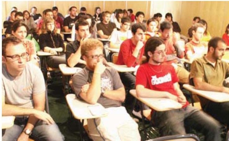
Estudiants en una de les xerrades impartides al Fòrum d'Ocupació 2009 al Campus de Gandia

Es tracta d'una excel·lent ocasió per als estudiants del Campus d'entablir relacions amb les empreses