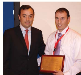
El professor del Campus Jaime Lloret

En aquesta edició de 2010 es van presentar un total de 74 Casos d'èxit, entre els quals van ser seleccionats 24 finalistes. A través d'un procés obert, prop de mil professionals del sector de tota Espanya han triat un guanyador en cadascuna de les vuit categories, entre elles, la d'Educació en la qual ha resultat guardonada la xarxa sense fil de la Universitat Politècnica de València.