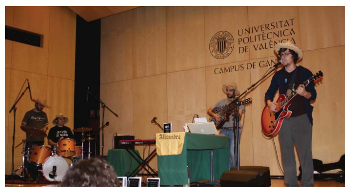
El grup mallorquí Oliva Trencada en el concert en l'Aula Magna del Campus

El dia 28 d'abril a les 18.00 hores a l'Aula Magna s'ha realitzat una cinefòrum sobre el Cinema i la Literatura titulat ' Companys de lletra ', on s'ha pro-