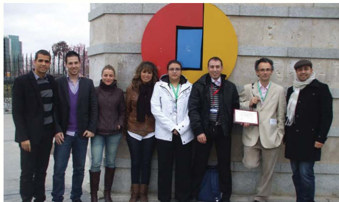
Diversos membres del Campus de Gandia de la UPV van anar a arrebregar el Premi

Lloret va arrebregar el guardó concedit per @asLAN/ en la 17a edició de SITI/asLAN, la Fira per a professionals especialitzada en xarxes i tecnologies convergents, celebrada aquesta setmana a Madrid. El professor Lloret va exposar a més en aquesta Fira els detalls del Cas d'Èxit "Disseny òptim de la xarxa sense fil i sistema automàtic de reubicació d'usuaris per a balancejar la càrrega de la xarxa", pel qual ha estat guardonada la UPV.