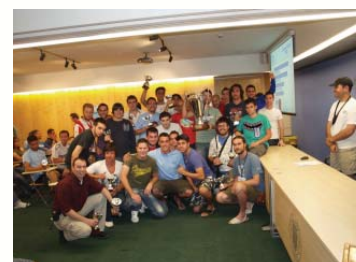
Entrega de premi a Telecomunicacions