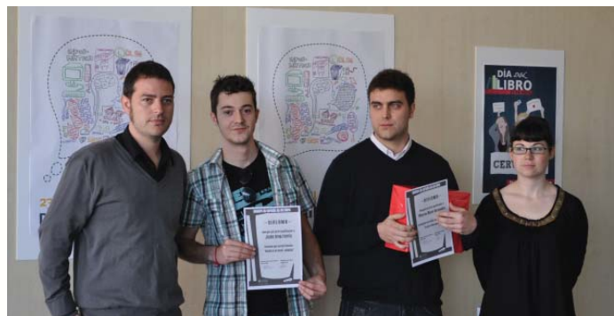
El Subdirector de Cultura entrega els premis del Concurs de Cartells del Dia del Llibre 2010

Per a aquells que prefereixen tocar i olorar els llibres la cita ha estat en l'àgora del campus, tant en la Fira del Llibre amb les casetes instal·lades per diferents llibreries, com amb l'intercanvi de llibres. Així, des del 21 d'abril fins