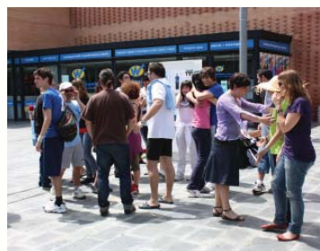
Participants en el taller de fisioteràpia a l'Àgora

Els més tranquils han pogut visitar una exposició de fotografia i material esportiu, organitzada per a l'ocasió per les seccions esportives del Campus. A més, tota la jornada i l'acte de lliurament dels trofeus ha estat amenitzat pel grup de Teatre del Campus de Gandia, Monminet.