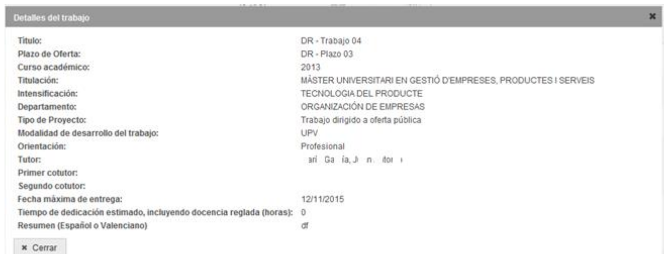
Figura 5 Diálogo con los datos de un TFG/TFM