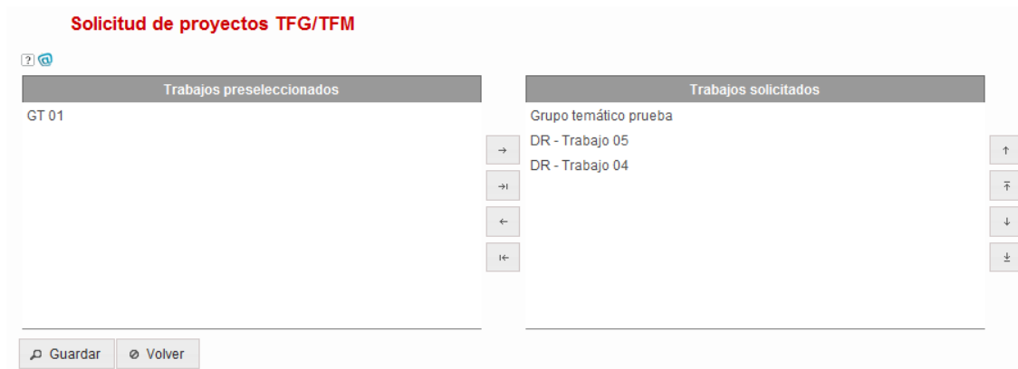
Figura 6 Lista de selección de proyectos TFG/TFM

En la pantalla de Solicitud de proyectos TFG/TFM aparecerá una lista de selección. En la parte de la izquierda aparecerán los Proyectos TFG/TFM preseleccionados pero no solicitados y en la derecha se mostrarán los Proyectos TFG/TFM solicitados. Los Proyectos TFG/TFM solicitados se pueden ordenar en base a las preferencias del alumno.