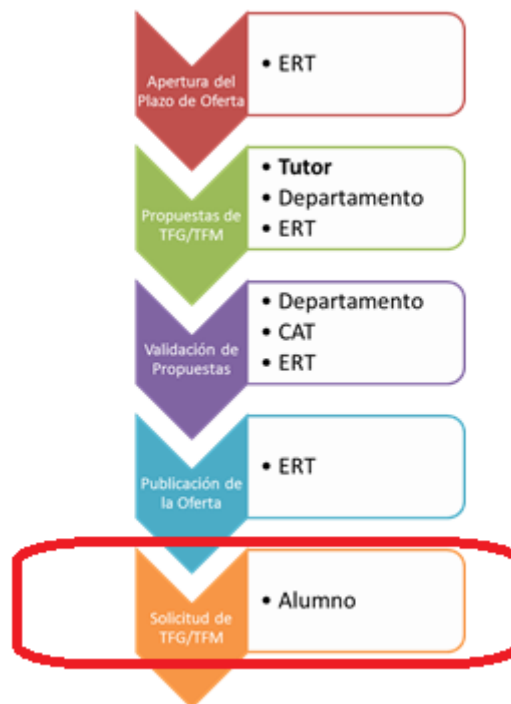
Figura 2 Proceso de Gestión de un TFG/TFM y el rol responsable (Oferta).

Un requisito necesario para que sea posible introducir propuestas de TFG/TFM en Ebrón es que la ERT correspondiente hay publicado un Plazo de Oferta con sus correspondientes fechas. Por tanto, el proceso completo es el mostrado en la Figura 2: