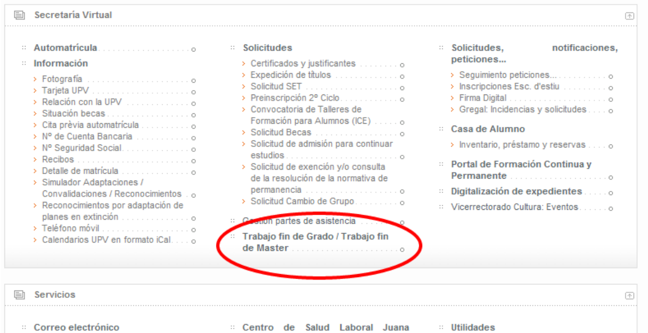
Figura 3 Acceso a la aplicación