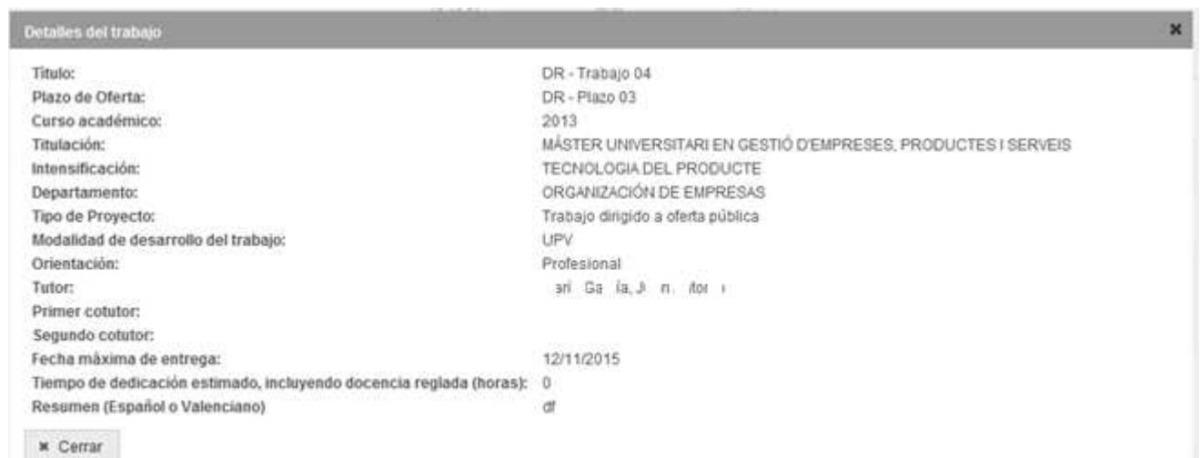
Figura 5 Diálogo con los datos de un TFG/TFM