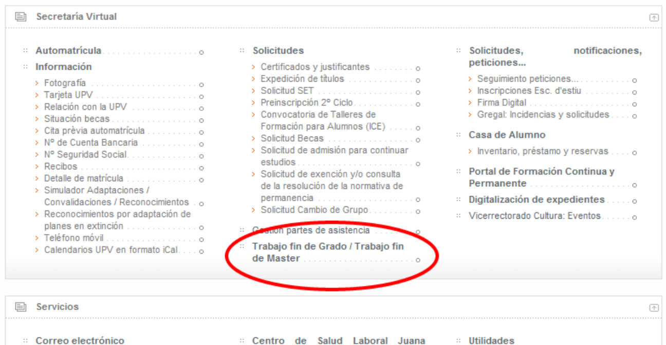
Figura 3 Acceso a la aplicación