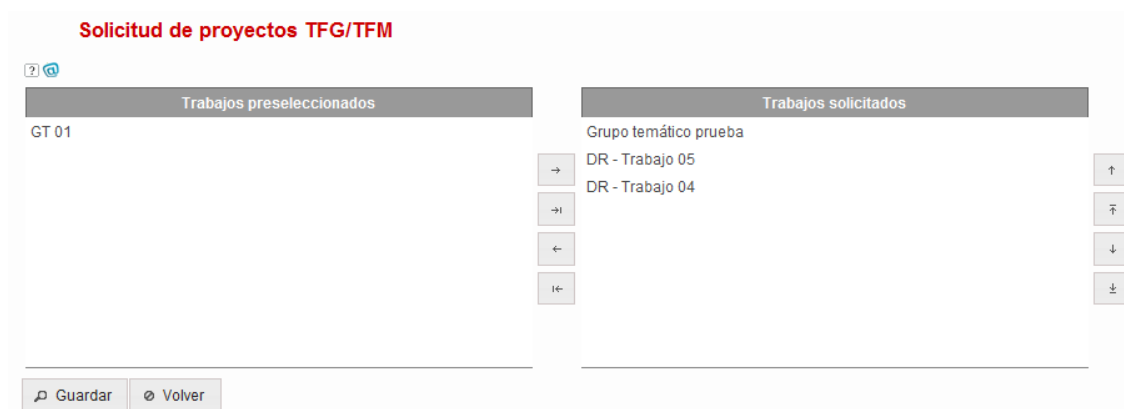
Figura 6 Lista de selección de proyectos TFG/TFM

En la pantalla de Solicitud de proyectos TFG/TFM aparecerá una lista de selección. En la parte de la izquierda aparecerán los Proyectos TFG/TFM preseleccionados pero no solicitados y en la derecha se mostrarán los Proyectos TFG/TFM solicitados. Los Proyectos TFG/TFM solicitados se pueden ordenar en base a las preferencias del alumno.