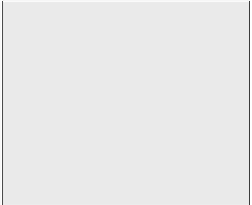
FOTOGRAFÍA ANTERIOR A LA RESTAURACIÓN