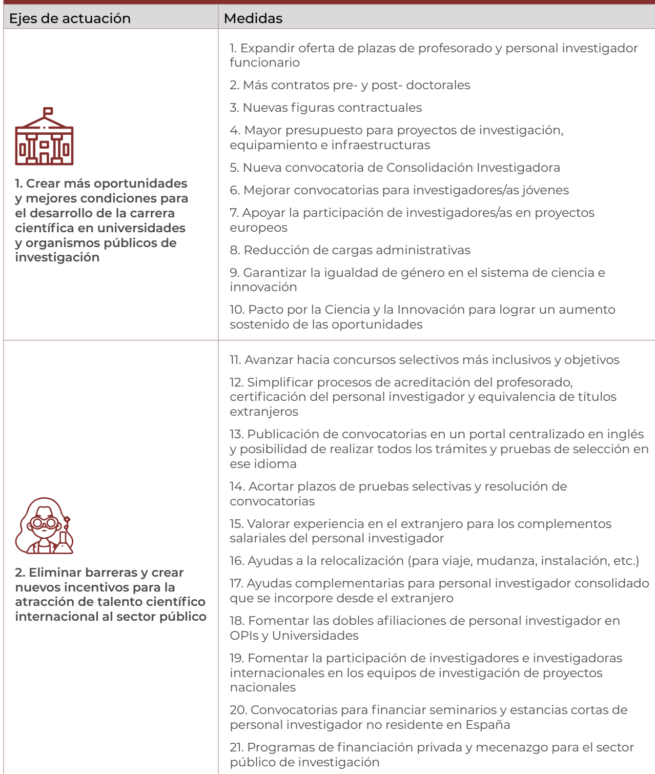
TABLA 1. PLAN DE ATRACCIÓN Y RETENCIÓN DE TALENTO CIENTÍFICO E INNOVADOR A ESPAÑA BATERÍA DE MEDIDAS PARA 2022-2023