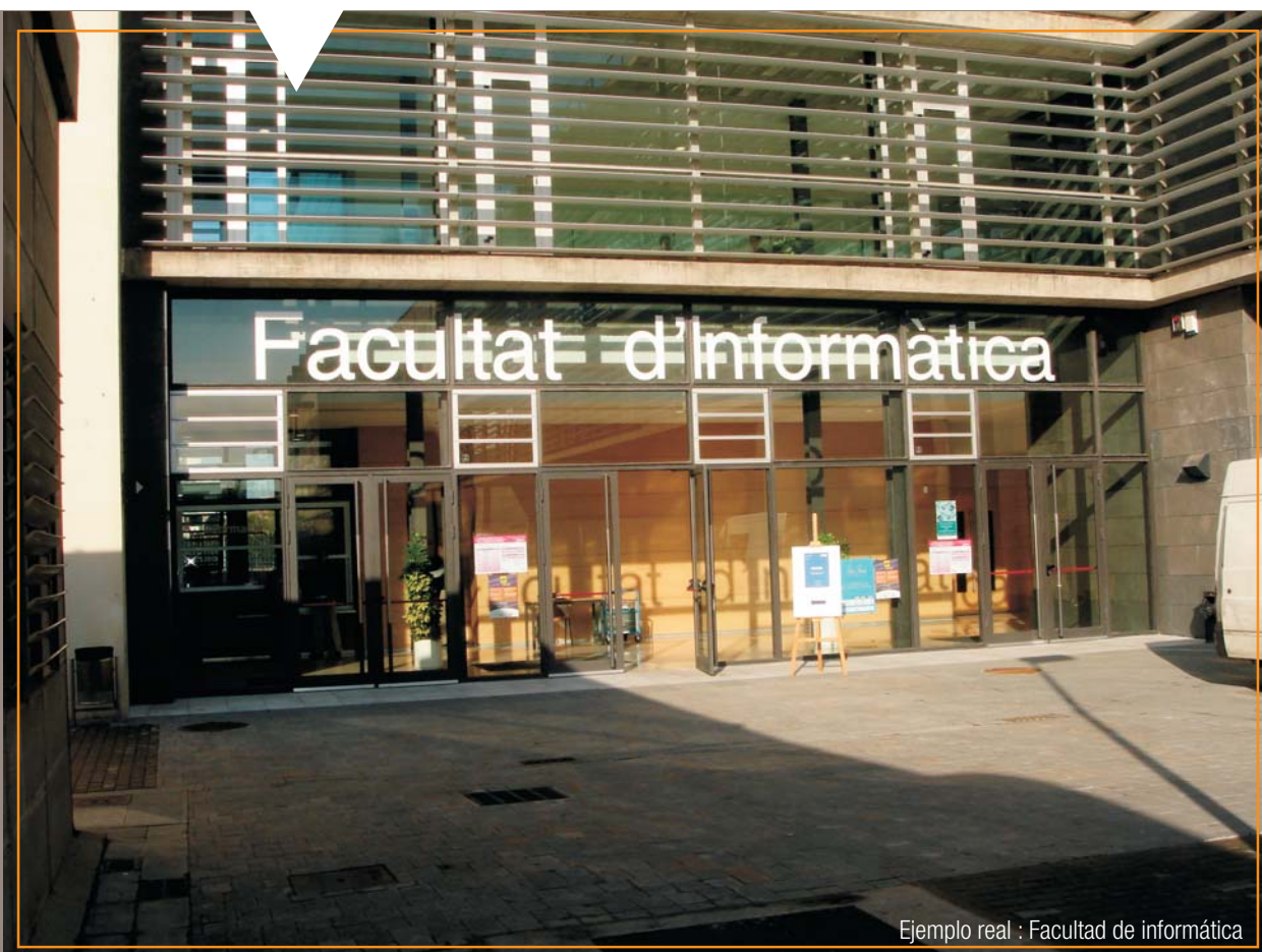
Ejemplo real : Facultad de informática

En cuanto al nombre del centro, situado junto al código alfanumérico, se utilizan letras en vinilo de color gris o blanco