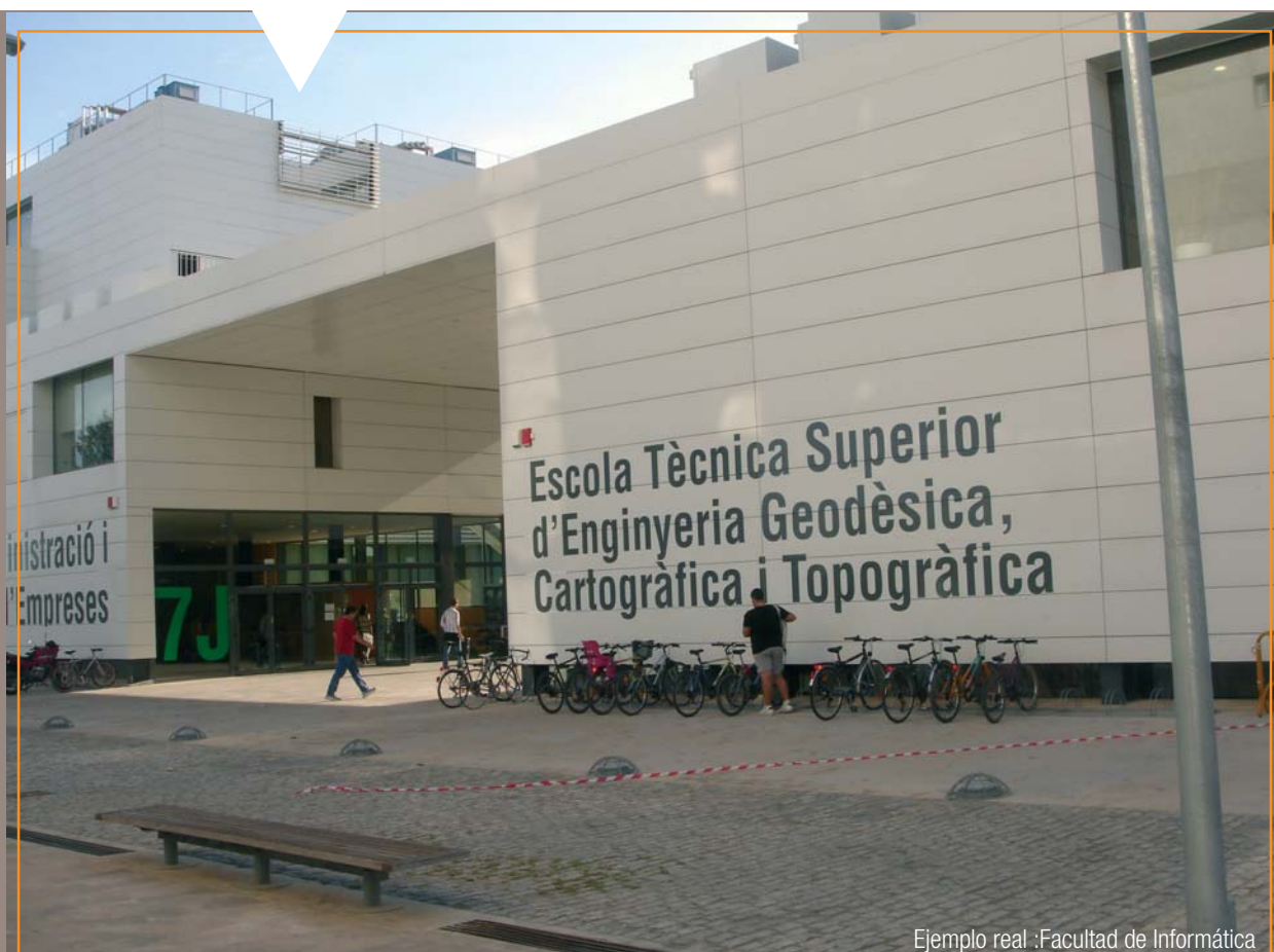
Ejemplo real :Facultad de Informática

El código alfanumérico a colocar en la fachada consiste en un número y una letra del color correspondiente a la subzona en la que se encuentra el edificio. El tamaño y posición de estos caracteres vendrán dictados por el objetivo de conseguir una buena visibilidad. El material elegido es el vinilo por su gran versatilidad a la hora de colocarse en diversas superficies y por la vistosidad de su gama de colores.