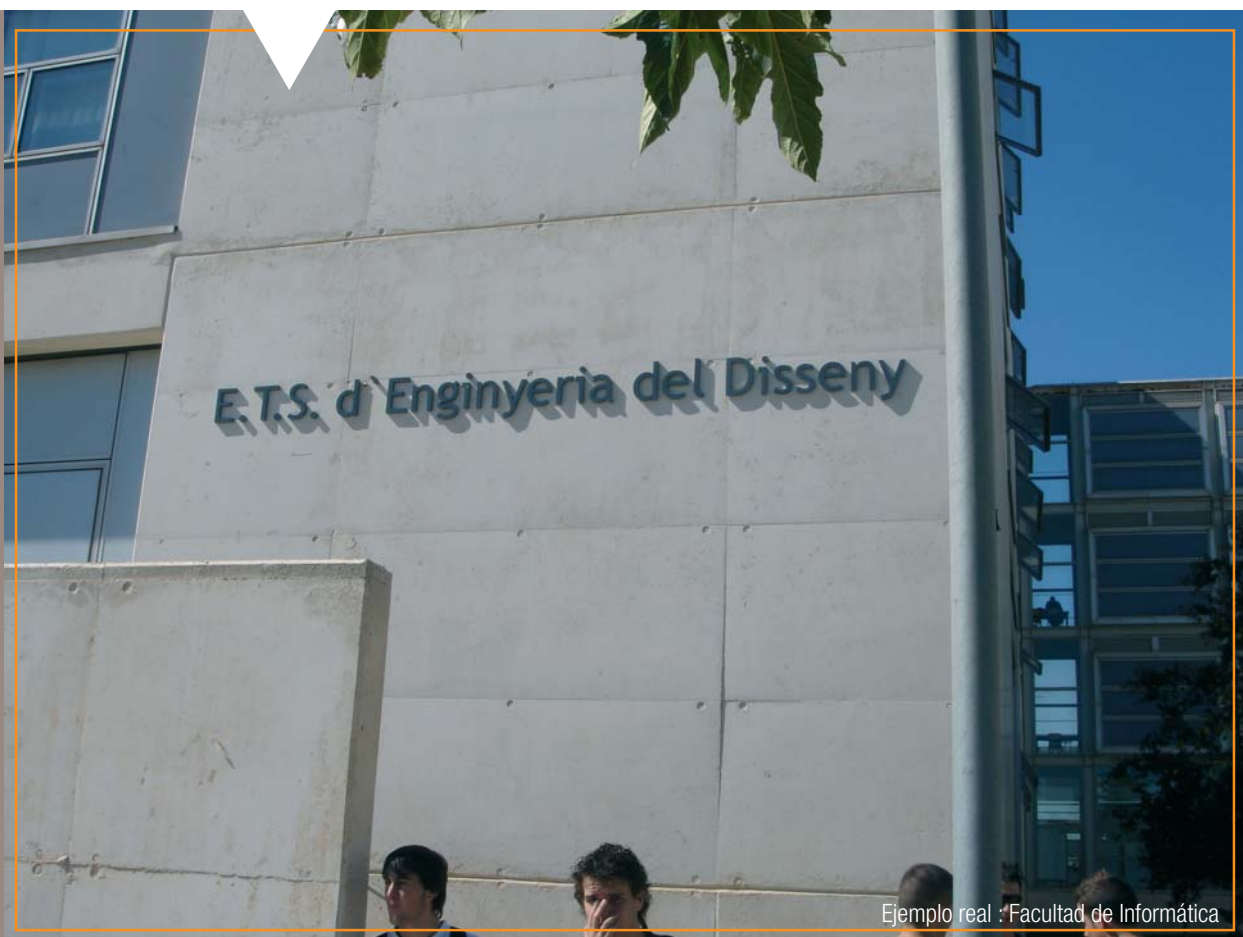
Ejemplo real : Facultad de Informática

Situadas a lo largo del perímetro de la Universidad Politécnica de Valencia.