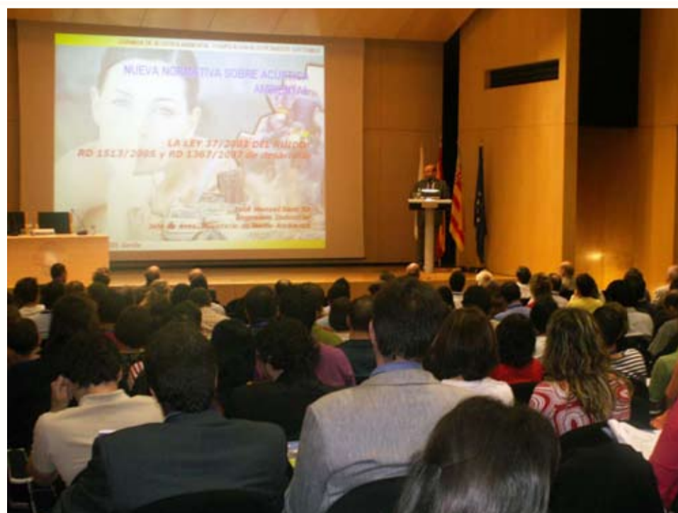
Imatge de la conferència del ponent del Ministeri de Medi Ambient a les Jornades

El dia 7 de maig es va centrar en l'edificació acústicament sostenible i