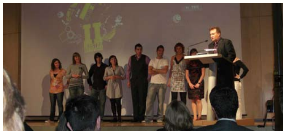
Imagen de Mostra't 2008