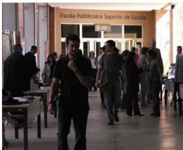
Imatge del Fòrum 2008, situat enfront de l'aulari

En total 20 organitzacions han participat al fòrum, totes elles amb presència a la Comunitat Valenciana i especialitzades en àrees d'activitat relacionades amb els estudis del Campus de Gandia de la UPV: Enginyeries Tècniques de Telecomunicació, Enginyeria Tècnica Forestal, Ciències Ambientals, Turisme i Comunicació Audiovisual.