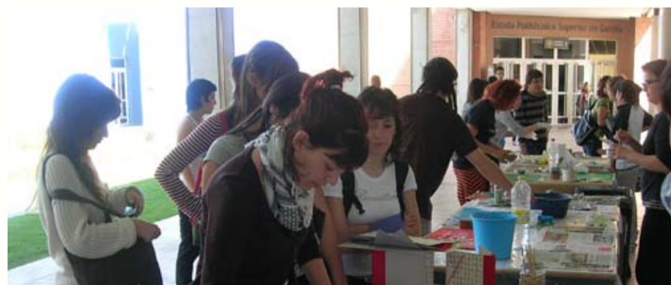
Setmana per la Llengua 2008 al Campus de Gandia de la UPV

El dia 23 de febrer era la celebració gran del Dia del Llibre i per això es van programar diverses activitats: un Taller d'il·lustració, on s'ensenyava a confeccionar carpetes i paper pintat per a cobertes de llibres; la fira del llibre, amb l'assistència de les llibreries Ambra, La Fona, CEIC, Alfons El Vell i la