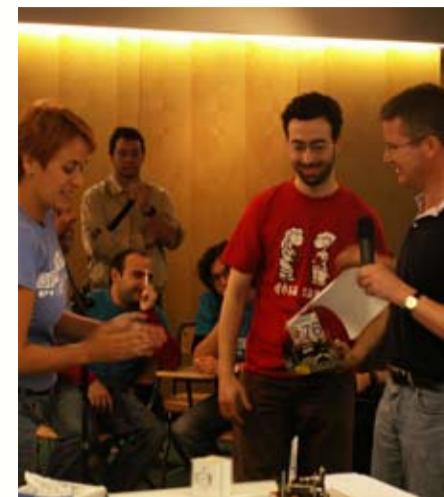
Entrega de premis

Aquests estudiants, de Projecte de Diversificació Curricular (PDC) de l'Institut, estaven especialment satisfets del seu resultat perquè,