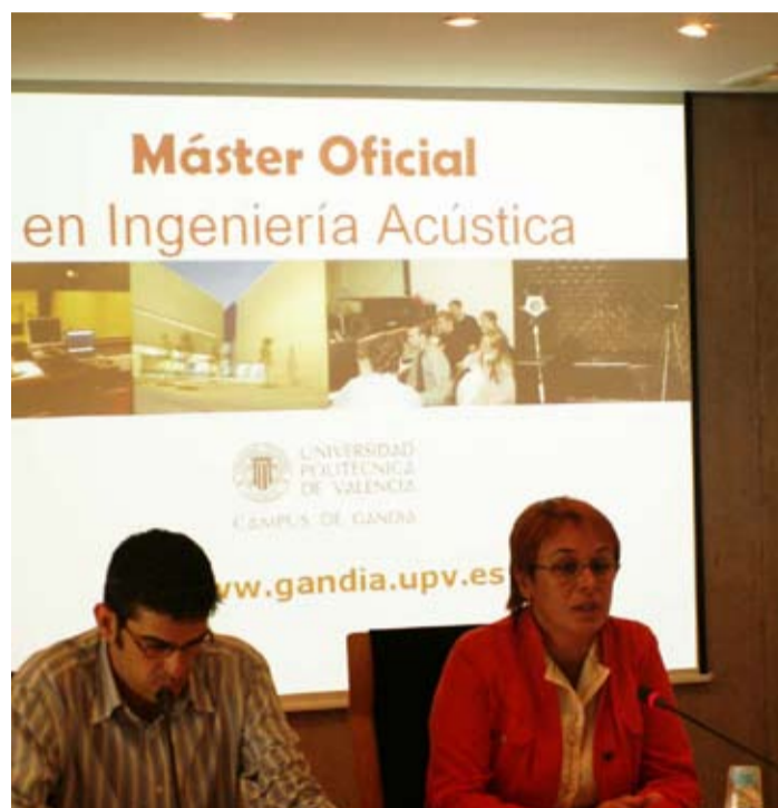
Presentación del Máster ante la prensa en el Campus de Gandia

Ahora el centro universitario aprovecha este bagaje para lanzar esta nueva titulación, que nace de los cimientos de la especialidad en sonido e imagen de la Ingeniería Técnica en Telecomunicación, título de Gandia que recientemente ha