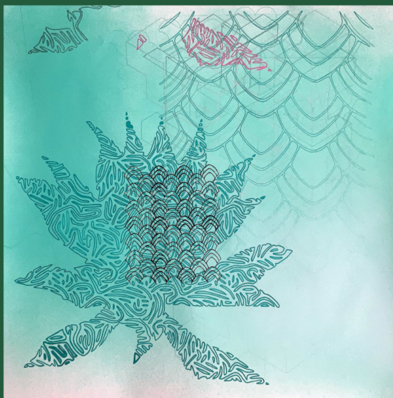
Diseño de Rossi Aguilar y Michael Urrea - Imagen de Carolina Valls

Feria de muestras de Valencia Avinguda de les Fires, s/n, 46035 (Valencia)