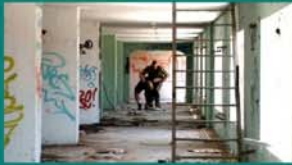
Xoan Anleo "Rotación"