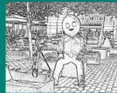
Altery'O KaosZ "Peza de carro (una revelación de música oculta)"