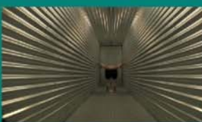
Colectivo VisualMadrid "Bi_polaridad"