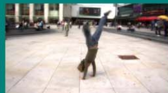
Samuel Domingo "Cross Platz"