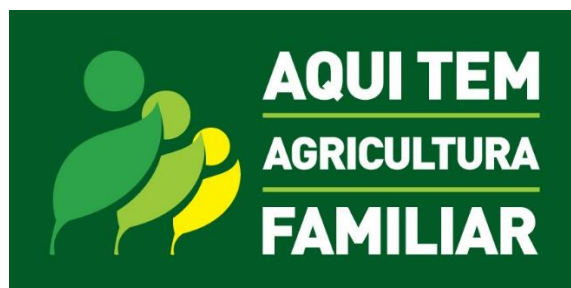
Gráfico 2 Selo da Identificação da Participação da Agricultura Familiar, SIPAF

En Brasil también existen instrumentos de promoción de la AF como el SIPAF (Sello de Identificación de la participación en la Agricultura Familiar, ver Gráfico 2), que es una marca de identificación de productos generados por los agricultores familiares y que tiene por objetivo fortalecer la identidad social de los productos de la AF visibilizándolos (FIDA Mercosur CLAEH, 2015).