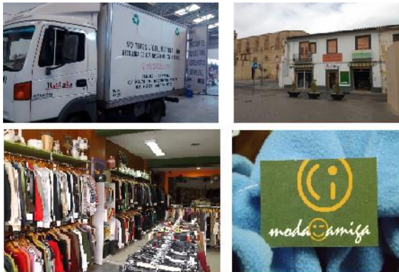
Figura 3. Algunas de nuestras