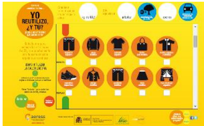
Figura 8. Calculadora de CO2