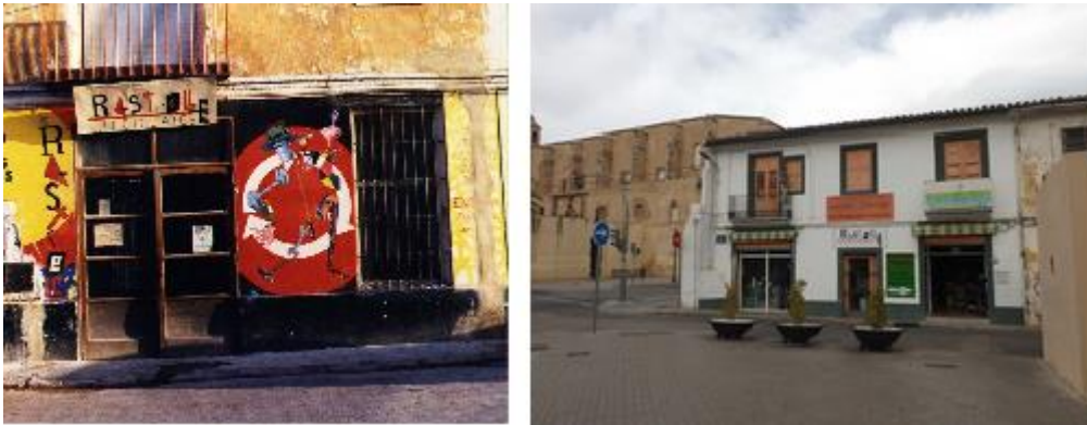
Figura 7. El Rastrell desde el origen a la actualidad