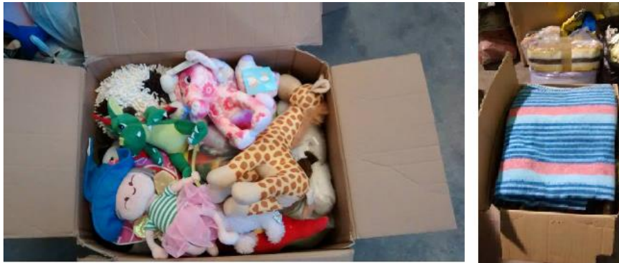
Figura 9. Imagen de las cajas de la campaña "¿Jugamos a compartir?" Y "La manta al coll per al Gosset"