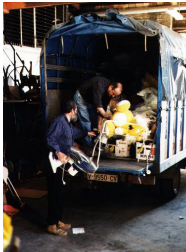
Figura 5. Nuestros compañeros cargando el camión en los inicios de la actividad