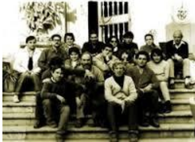
Figura 1. Miembros de la entidad en sus inicios