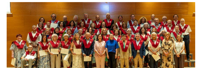
3º PROMOCIÓN GRADO SÉNIOR UPV 2025-2026