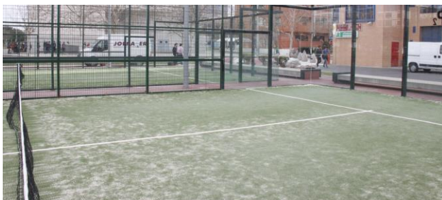
Foto estado una vez sustituido el pavimento.