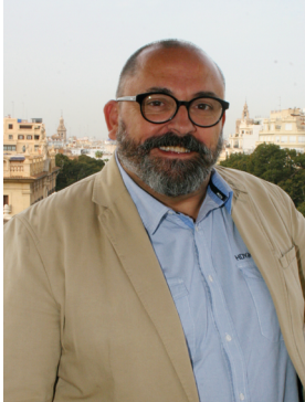
D. ENRIC NOMDEDEU I BIOSCA SECRETARI AUTONÒMIC D'OCUPACIÓ I DIRECTOR GENERAL DEL SERVEI VALENCIÀ D'OCUPACIÓ I FORMACIÓ (SERVEF)

En el món actual, les noves tecnologies juguen un paper fonamental en pràcticament tots els àmbits i, com no podia ser d'altra manera, també en l'àmbit de l'ocupació. No obstant això, hi ha qüestions que no poden escapar dels espais de trobada i reflexió on compartir idees i experiències que enriqueixen respostes als reptes econòmics que se'ns presenten.