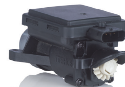
Electrical swirl flap actuator