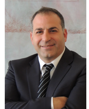
D. JOSÉ MILLET ROIG SR. VICERRECTOR DE EMPLEO Y EMPRENDIMIENTO

En definitiva, de la mà de les universitats i el teixit econòmic valencià, tenim el compromís de millorar el futur treballant el present, per tal d'assolir una economia al servei de les persones, que faça possible noves oportunitats de treball digne i estable per a la nostra gent.