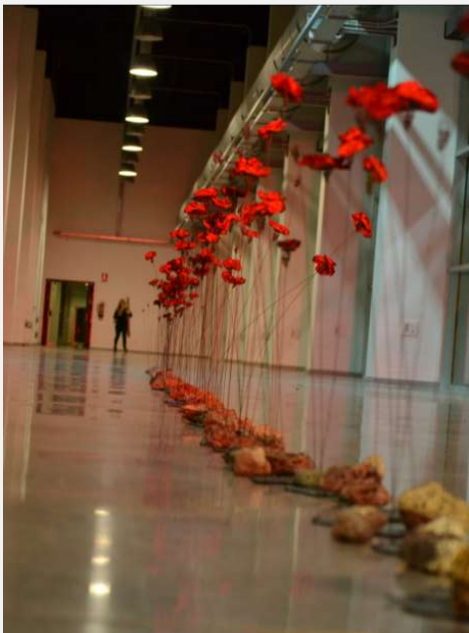
Imagen 1 - Obra 2