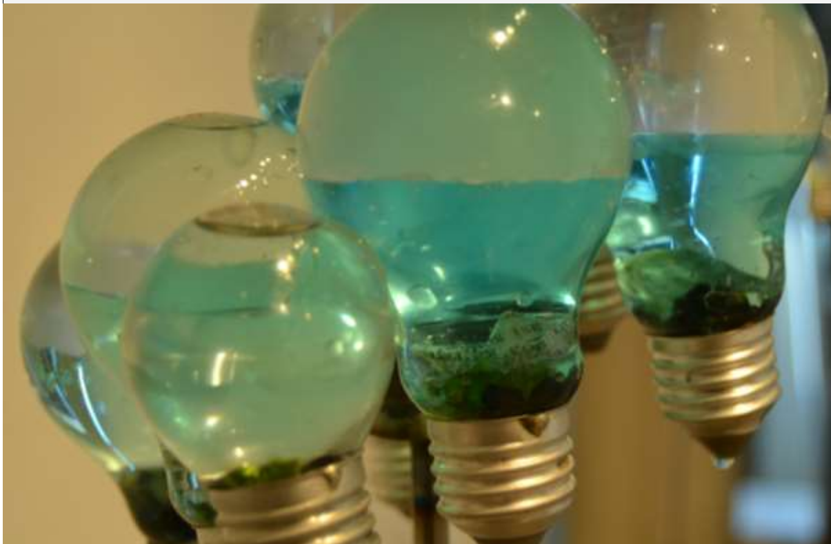
Imagen 2 - Obra 1