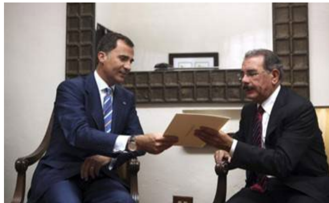
Foto: Su Majestad El Rey, Felipe VI, junto al Presidente Danilo

Puede decirse que República Dominicana por tradición y por vocación es un país que fomenta su herencia hispánica, lo que facilita que los puntos de vista políticos en muchos casos sean convergentes. Así, República Dominicana se cuenta entre los firmes defensores del sistema de Cumbres Iberoamericanas, y los apoyos mutuos son constantes. República Dominicana apoyó la candidatura española al CSNU 2015-2016. España y República Dominicana disponen de más de 20 Tratados bilaterales en vigor que cubren los ámbitos consular y de asistencia judicial, económico o de cooperación.