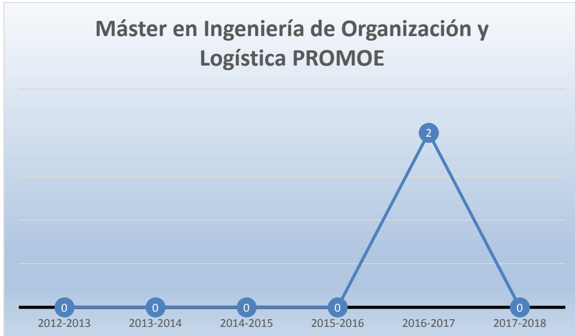
Gráfico 3- Número de estudiantes salientes MUIOL con beca PROMOE por año académico