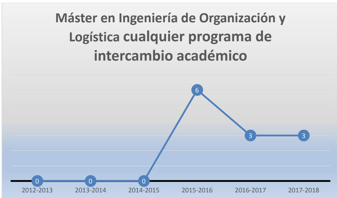
Gráfico 1 - Número de estudiantes salientes MUIOL de cualquier programa de intercambio académico del año 2012-2013 hasta el 2017-2018