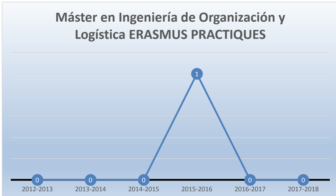
Gráfico 5 - Número de estudiantes salientes MUIOL con beca Erasmus Prácticas por año académico