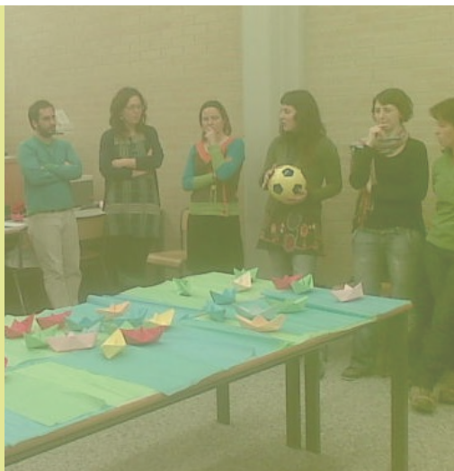
Evaluación de Asignatura. Máster Políticas y Procesos de Desarrollo