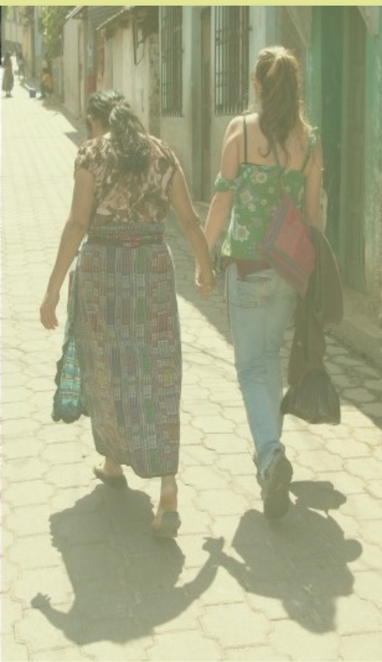
“Comunidad en Guatemala” por Estela López

Los alumnos y alumnas que finalicen satisfactoriamente ambos periodos recibirán la titulación de Máster Universitario en Cooperación al Desarrollo, Especialidad de Gestión de Proyectos y Procesos de Desarrollo .