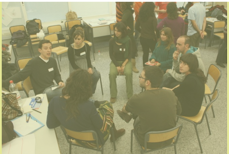
Taller de participación. Máster Políticas y Procesos de Desarrollo