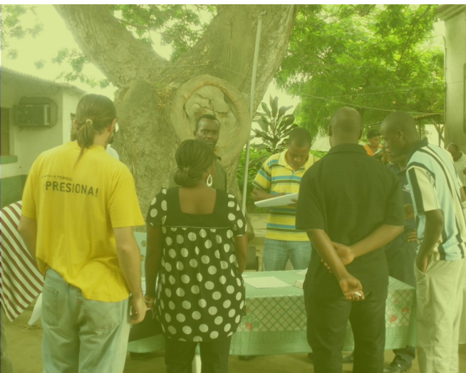
“Acompañamiento a procesos en Angola” por Andrés Hueso

La principal fuente para la evaluación será la realización de trabajos autónomos (trabajos prácticos, proyectos, ensayos, estudios de caso...), individuales o en grupo, así como actividades y prácticas en aula. Se realizará también un examen global de integración de conocimientos para cada asignatura.