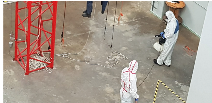
Tareas de limpieza y desinfección profesional de las instalaciones, mayo 2020

8 El centro facilitará a los alumnos los equipos de protección individual relacionados con los riesgos de caída en altura para la realización del curso (arneses, cascots, sistemas anticaídas, etc.) además de espráis y geles hidroalcohólicos, pañuelos desechables y guantes.