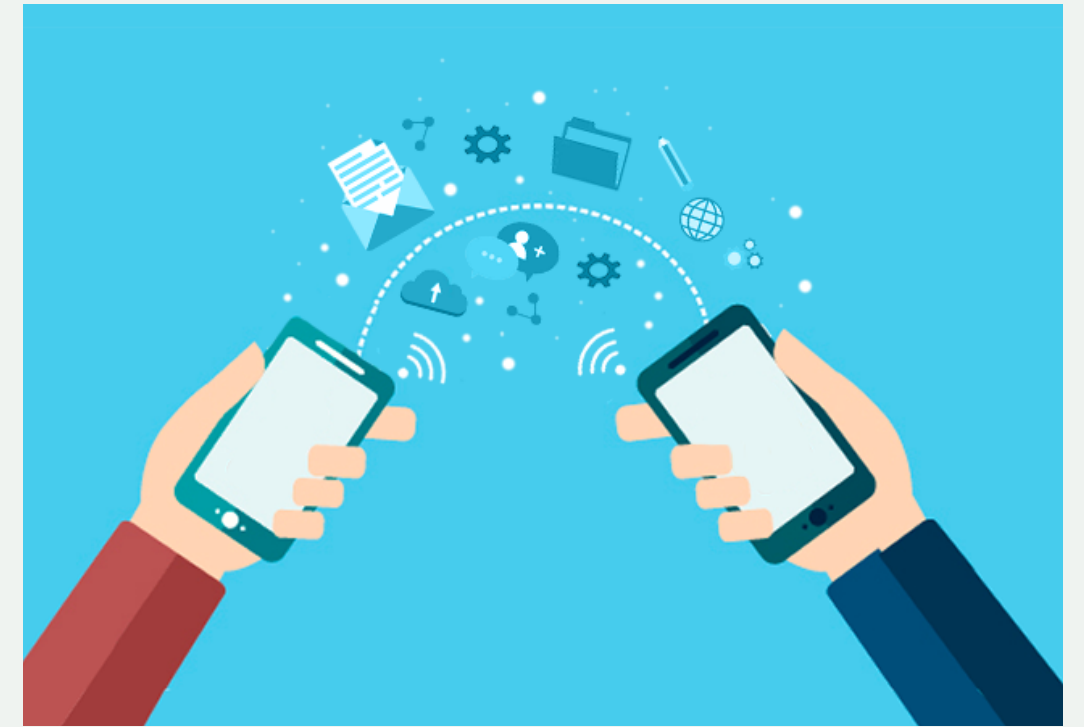
GESTIÓN DE PROYECTOS

ACERCAMIENTO A LA DEFINICIÓN DE PLATAFORMAS DE TRABAJO COLABORATIVO AUDIOVISUAL, A TRAVÉS DE VARIOS CONCEPTOS.