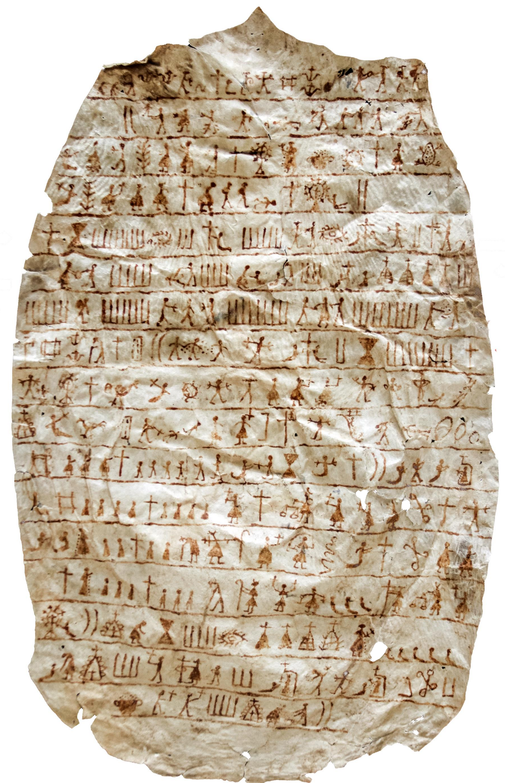
Cuero: 76 x 46 cm.

El trabajo investigativo tiene un carácter descriptivo, interpretativo, histórica, documental y hermenéutica que se pretende así misma como crítica, con rigurosidad científica y estrictos parámetros metodológicos.