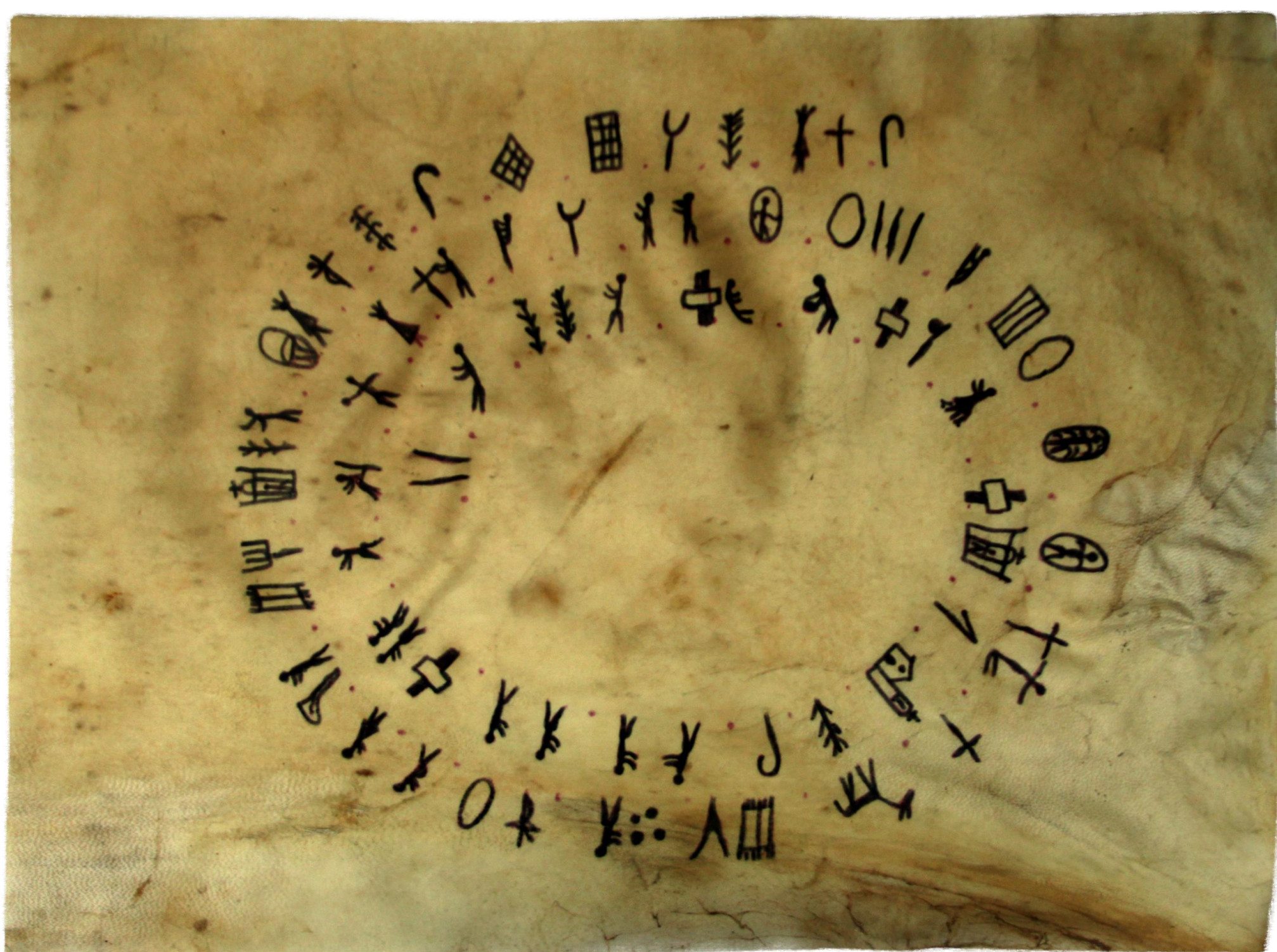
Cuero: 35.5 x 26 cm.