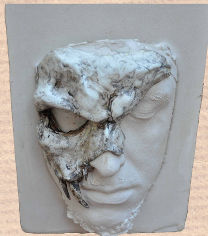
Máscara de "caracterización" modelada sobre soporte de escayola. Las famosas máscaras de carnaval venecianas y las máscaras del día muertos ya recogían el uso de este material.