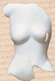
"Torso I" Pieza realizada en paperclay a partir de la técnica del apretón usada en cerámica.