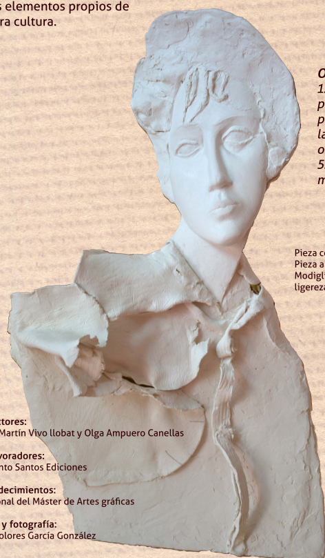
Pieza central. "Infanta Margarita", óleo sobre pasta de papel. Pieza abajo izquierda. "Mujer con corbata II". Basado en una obra pictórica de Modigliani y modelado a partir de láminas. El papel le confiere a las piezas su ligereza y versatilidad permitiendo además una gran variedad de acabados.