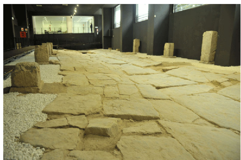
Vía Augusta en Morería (Sagunto)