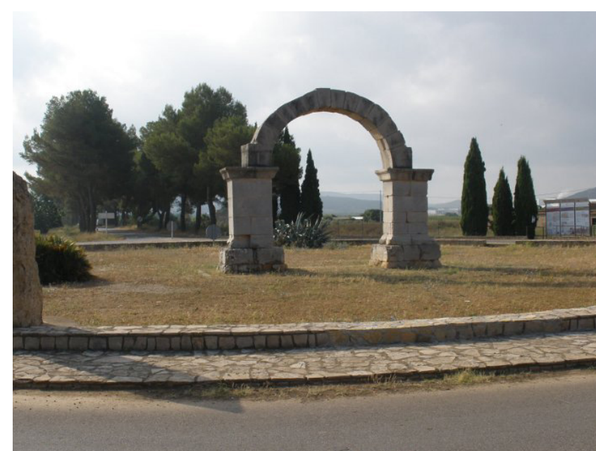
Arco de Cabanes (Castellón)