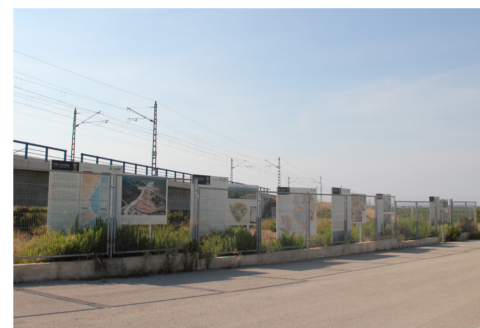
Yacimiento Els Alters