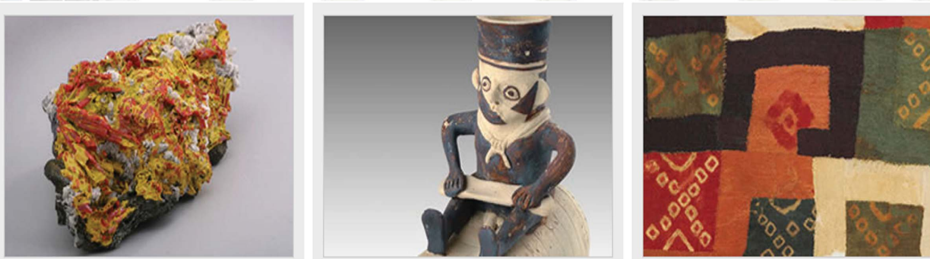
Figura 1. Colecciones del Museo de Minerales Andrés del Castillo.

Estos sujetos patrimoniales ven en el objeto cultural no solo valores históricos, sociales, políticos, económicos, artísticos, turísticos, etc; sino que también reconocen en él una carga identitaria, simbólica, emotiva y afectiva. Es el fomento de estos valores lo que fortalece el vínculo entre los sujetos y los objetos, repercutiendo por ende significativamente en el incremento del interés por la conservación de los bienes. Centrándose el presente estudio en el público infantil y juvenil, a partir de las conclusiones obtenidas en el trabajo final del máster Ciencia y Restauración de Bienes Culturales: La Didáctica como herramienta indispensable para la sensibilización en la conservación y Restauración del Patrimonio: el caso del Parque Arqueológico de Cochasquí, Ecuador .