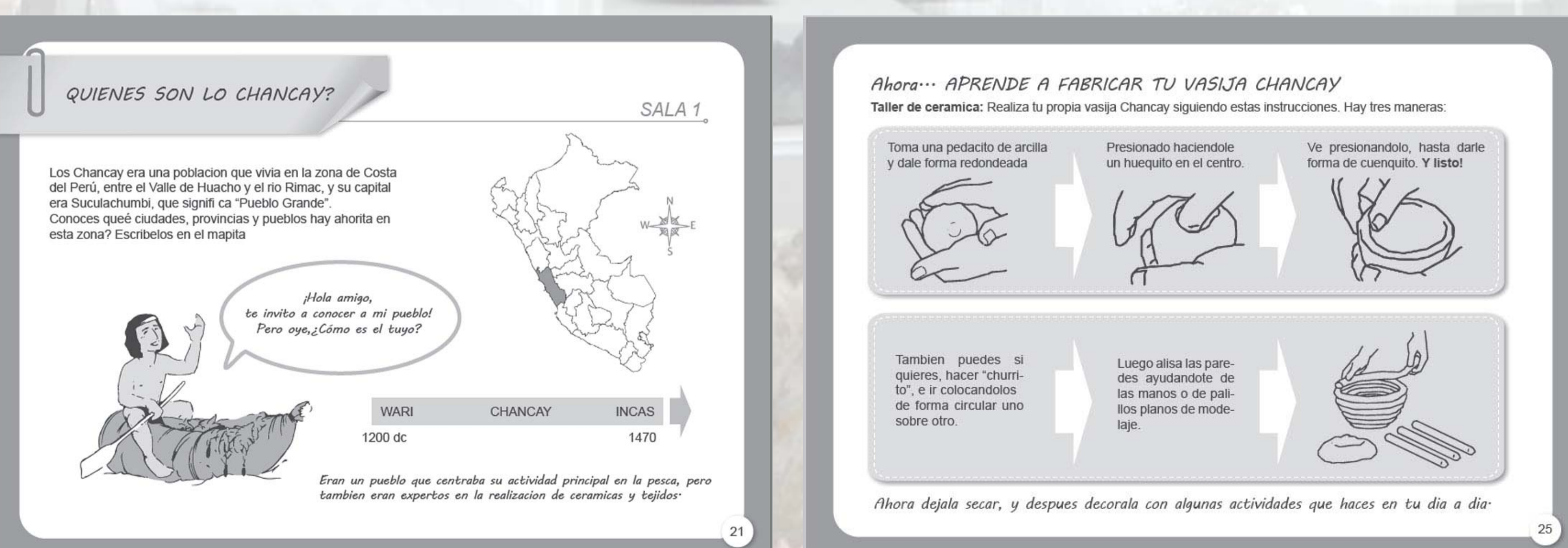
Figura 3. Fichas didácticas de la Colección de cerámicas Chancay del Museo Andrés del Castillo.

Es competencia de los conservadores-restauradores la difusión y divulgación de nuestro trabajo entre la sociedad, involucrándonos necesariamente en aquellas estrategias que contribuyan a evitar la degradación de los bienes, al menos las atribuidas al factor humano.