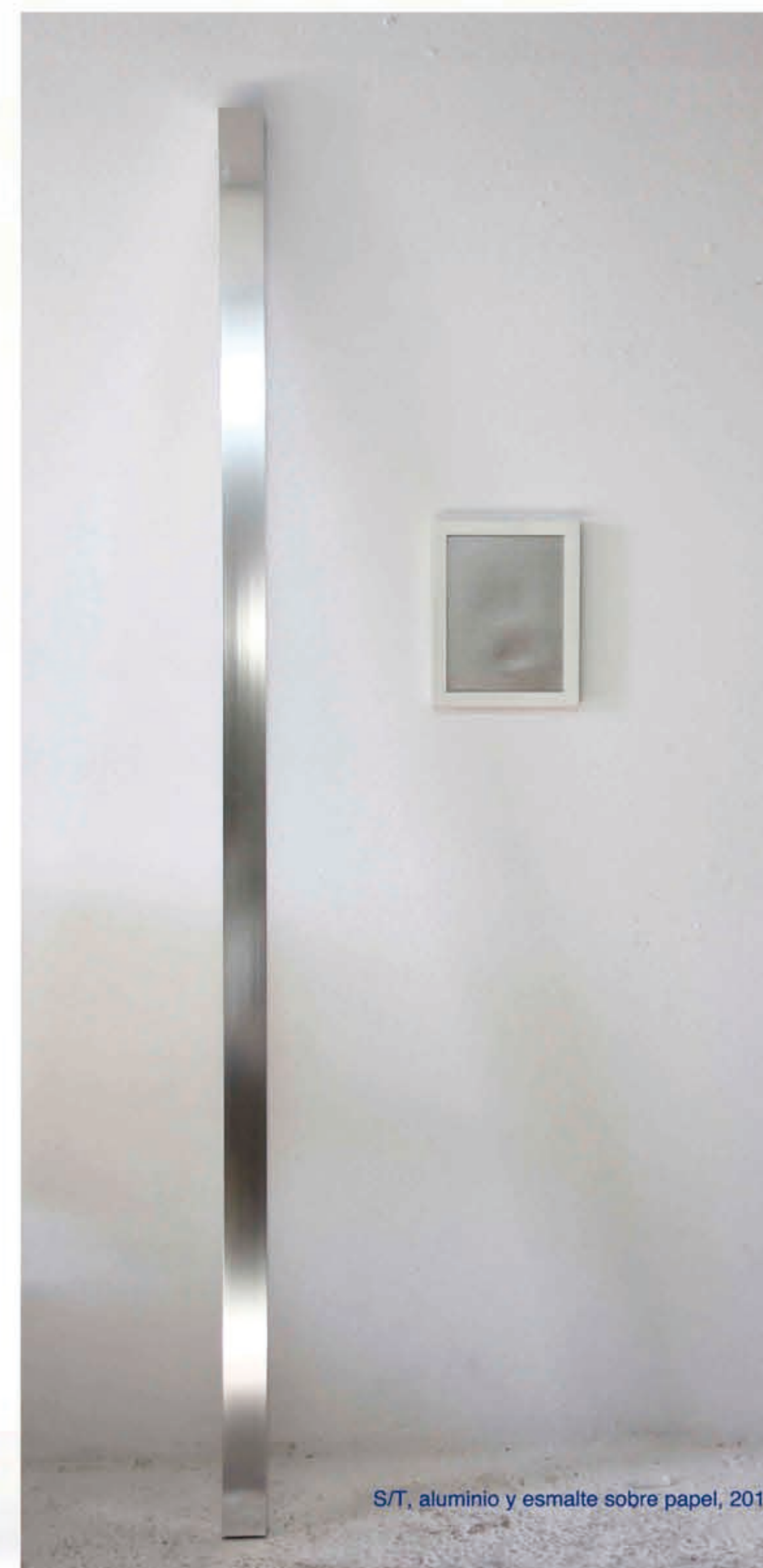
S/T, aluminio y esmalte sobre papel, 2014