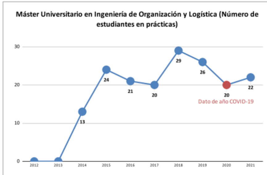
Gráfico 4– Número de estudiantes que han realizado prácticas por año natural