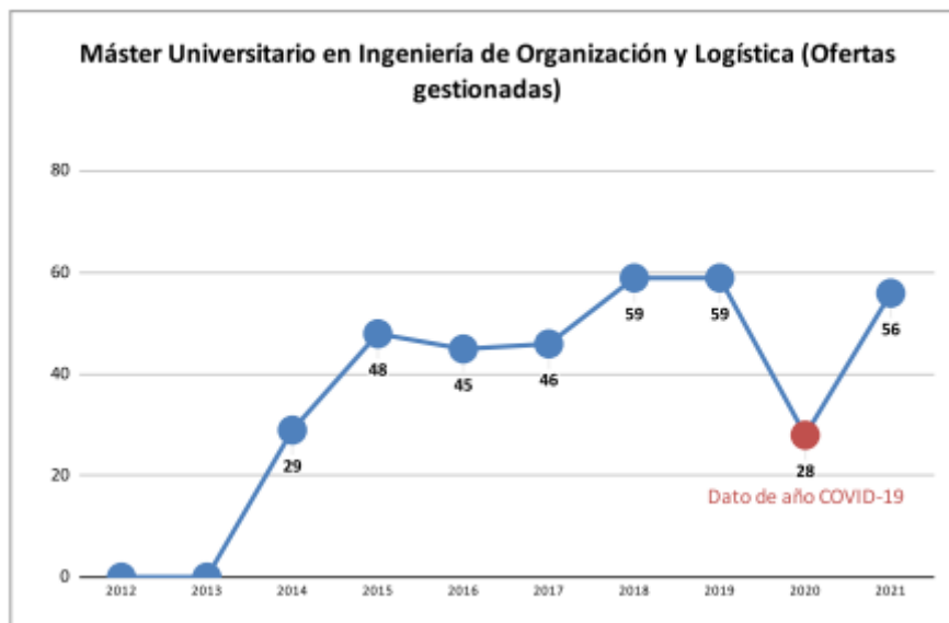
Gráfico 5– Número de ofertas de prácticas gestionadas por año natural