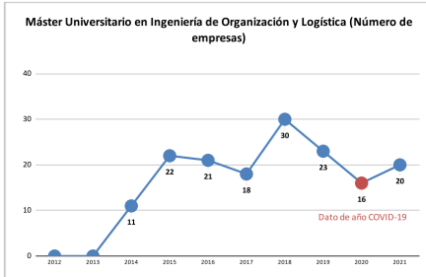
Gráfico 2–Número de empresas colaboradoras por año natural