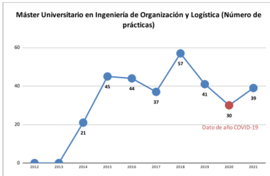
Gráfico 1 –Número de prácticas en empresa por año natural

Base de datos – Servicio Integrado de Empleo – UNIVERSITAT POLITÈCNICA DE VALÈNCIA