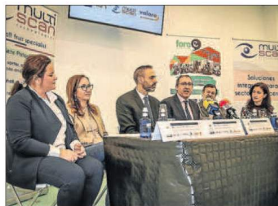
Imagen de la presentación ayer del Foro de Empleo.