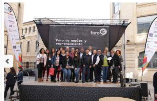
UPV Alcoi / 19/04/2018