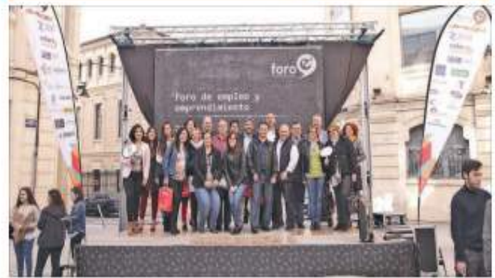
Grupo de participantes y organizadores del Foro del Empleo y Emprendimiento del Campus.

Por la tarde, también en la Plaza Ferrándiz y Carbonell, tendrá lugar a partir de las 16:30h el Elevator Pitch o TFM en un escenario, delante de unas 20 empresas, durante 90 minutos. Todas las empresas tendrán un book, con el currículum de todos los que participen en esta modalidad. Habrá un curso gratuito para formar a los alumnos interesados. Al final, tendrá lugar una picaeta/networking