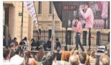
Uno de los participantes en 'Somos Monos'.

Por la mañana se realizaron diferentes actividades en las carpas que se instalaron en la plaza Ferrándiz y Carbonell. En la carpa del país invitado, Alemania, se dio a conocer el mercado laboral alemán y se ofrecieron consejos para encontrar trabajo en este país. También se ofreció un taller de fotografía profesional para el currículum, organizado por SomosMonos. Por la tarde, se celebró el Elevator Pitch o TFM, donde los alumnos presentaron sus ideas a un panel de jueces formado por 20 empresas. Al final, se realizó una picaeta/networking.