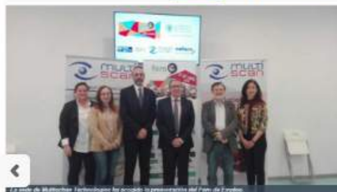
La sede de Multiscan Technologies ha acogido la presentación del Foro de Empleo.