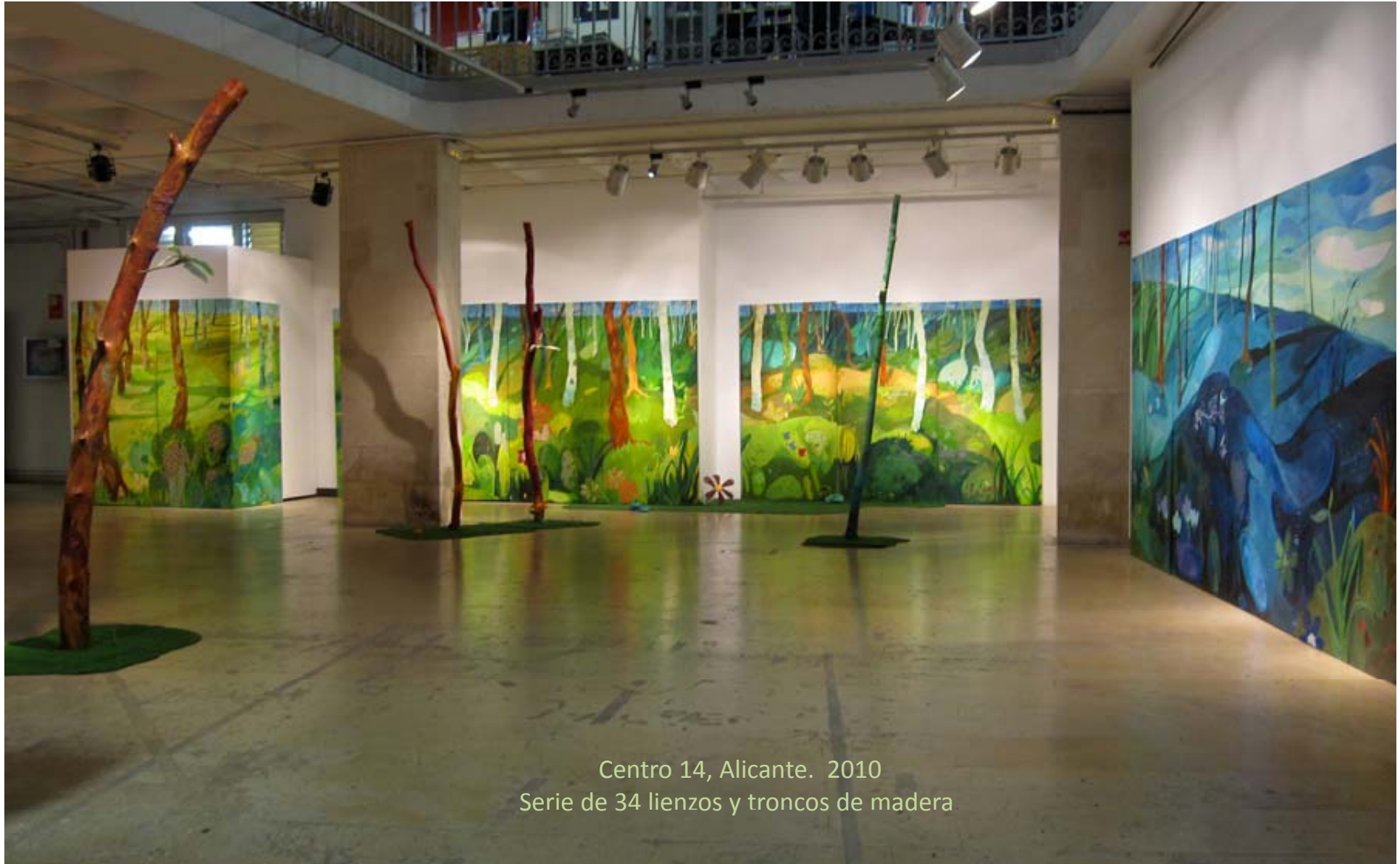
Centro 14, Alicante. 2010 Serie de 34 lienzos y troncos de madera