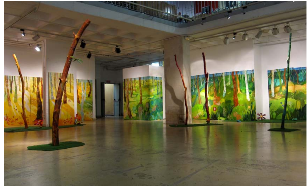
Centro 14, Alicante. 2010 Serie de 34 lienzos y troncos de madera.