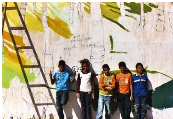
Tifariti, Sahara Occidental. 2008 Pintura plástica y tintes/muro