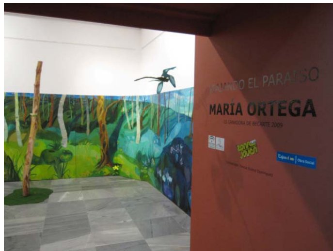
Museo de Huelva. 2009 Serie de 34 lienzos y troncos de madera.