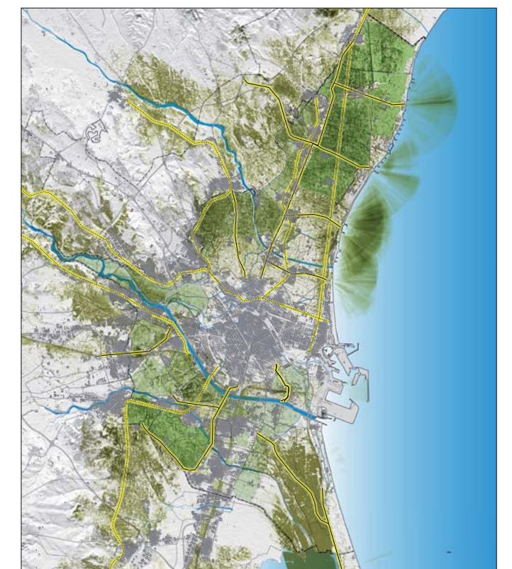
2. VISIBILIDAD DESDE PUNTOS SECUNDARIOS