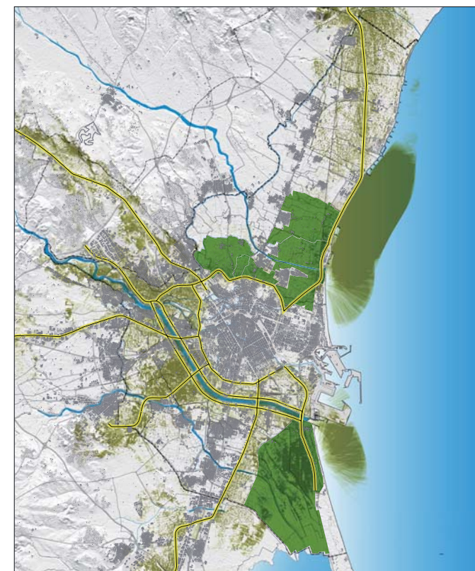
1. VISIBILIDAD DESDE PUNTOS PRINCIPALES

La visibilidad pondera el valor del paisaje de la huerta otorgado por la población y expertos, aumentando su valor cuando dicho paisaje es especialmente visible. Desde el equipo técnico del PAT para la protección del paisaje de la huerta de Valencia, se mantiene el valor otorgado por la media de la población y expertos cuando un espacio de huerta tiene una baja visibilidad, de esta forma no reducimos su valor.