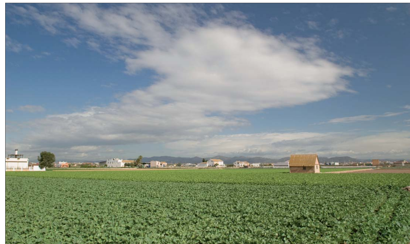
Imagen 02-14: Huerta de Almàssera