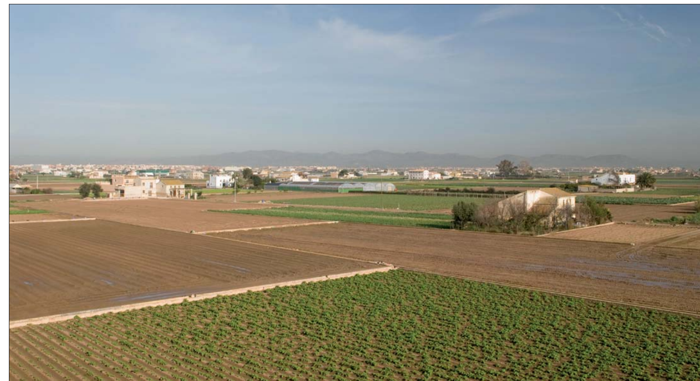
Imagen 02-13: Huerta de Almàssera

Huerta que posee una estructura singular de acequias (suministro) y azarbes (drenaje), y sobre la que también hay que destacar su estado de confinamiento. Su actual inconexión con otros sistemas de huerta, la degradación del borde y la aparición de diversos conflictos está alterando las propiedades paisajísticas de la pieza.