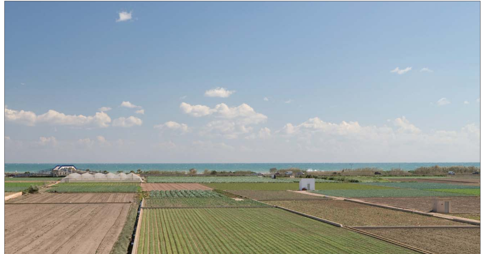
Imagen 02-11: Paisaje de huerta litoral, con el fondo escénico del mar