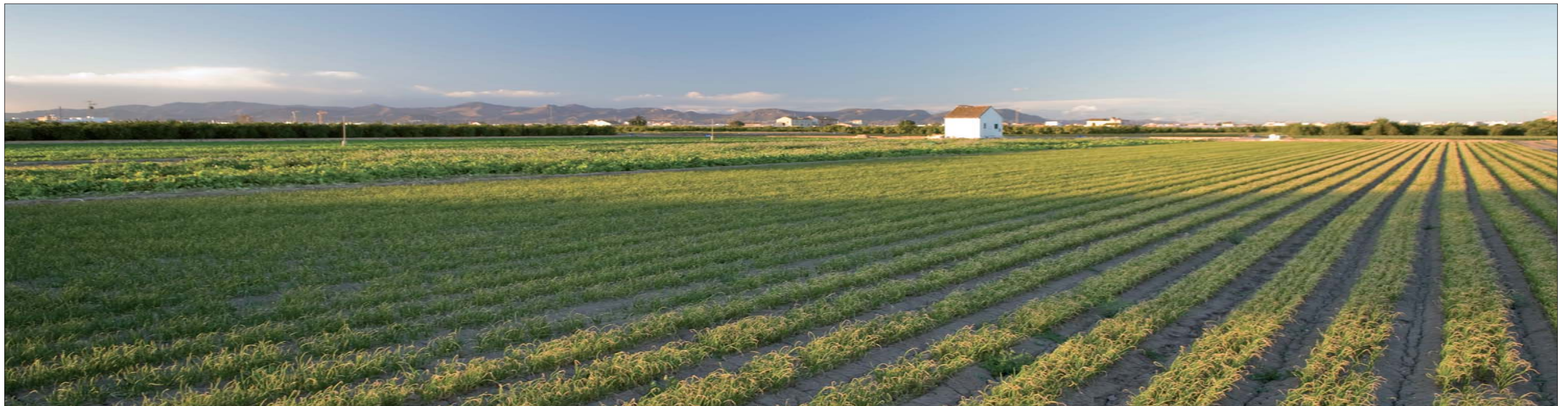
Imagen 02-12: Paisaje de huerta de una gran amplitud visual y con el valor añadido de contar con Serra Calderona como fondo escénico