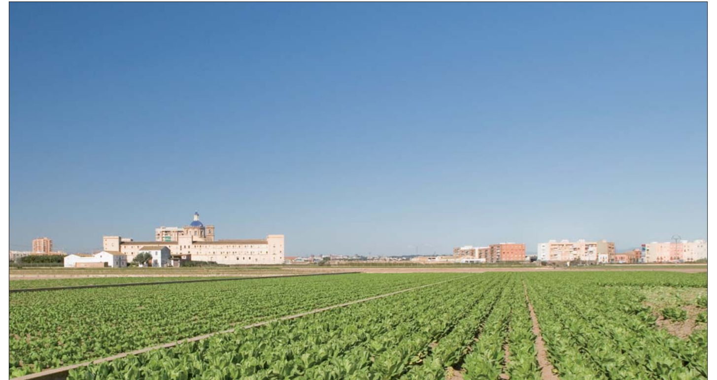
Imagen 02-17: Huerta de Sant Miquel dels Reis