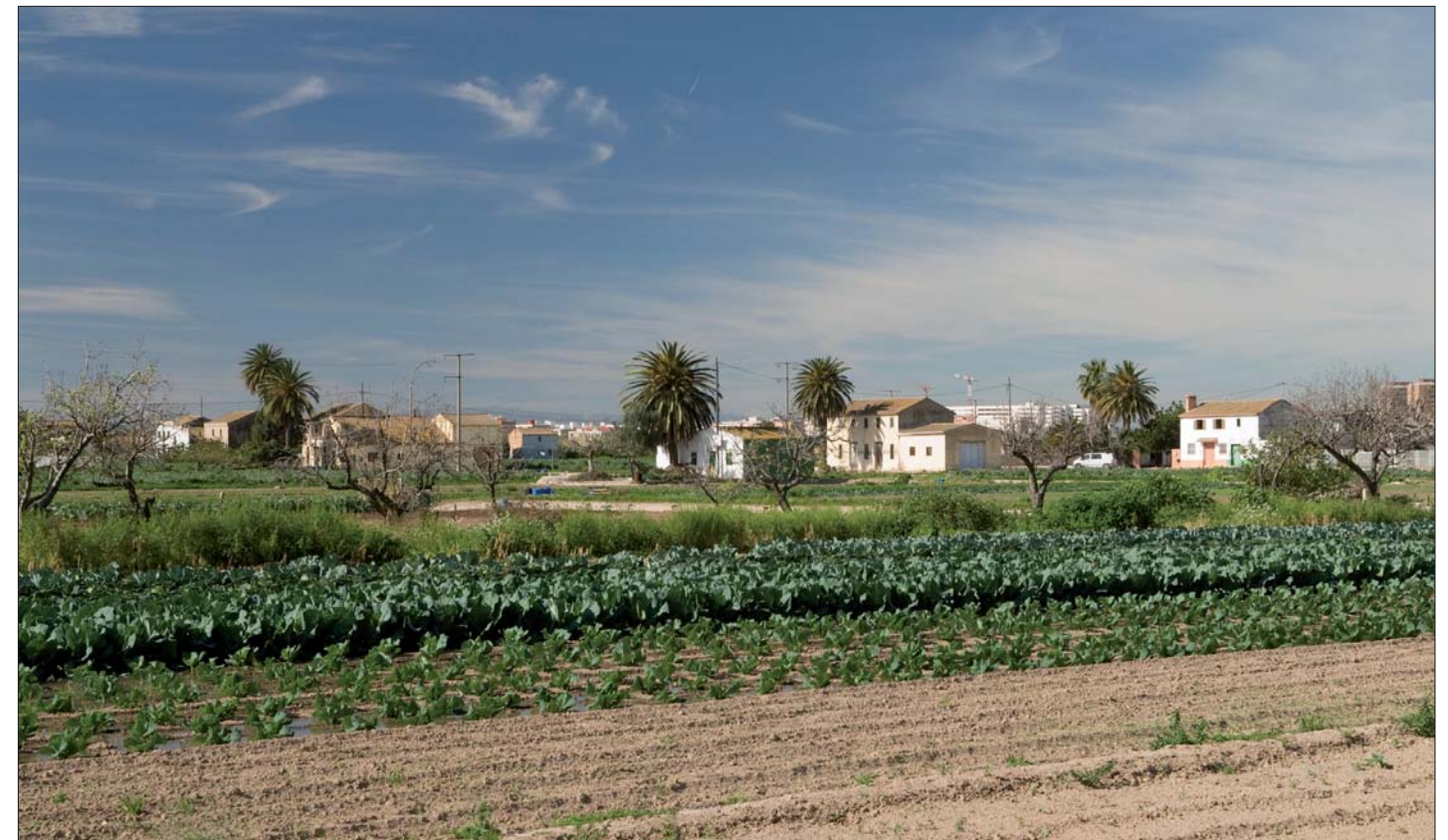
Imagen 02-18: Huerta de Rovella