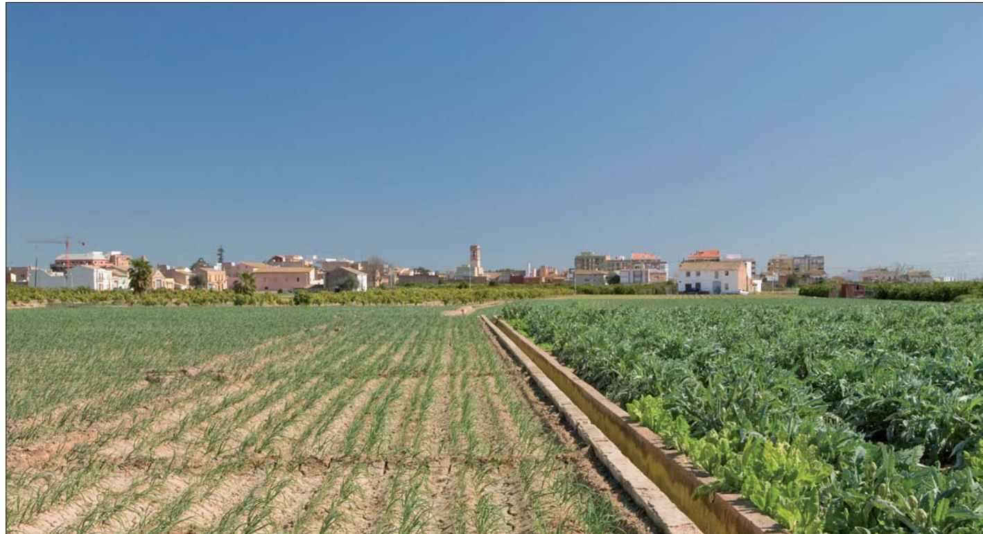
Imagen 02-15: Paisaje de la Huerta del Arco de Moncada