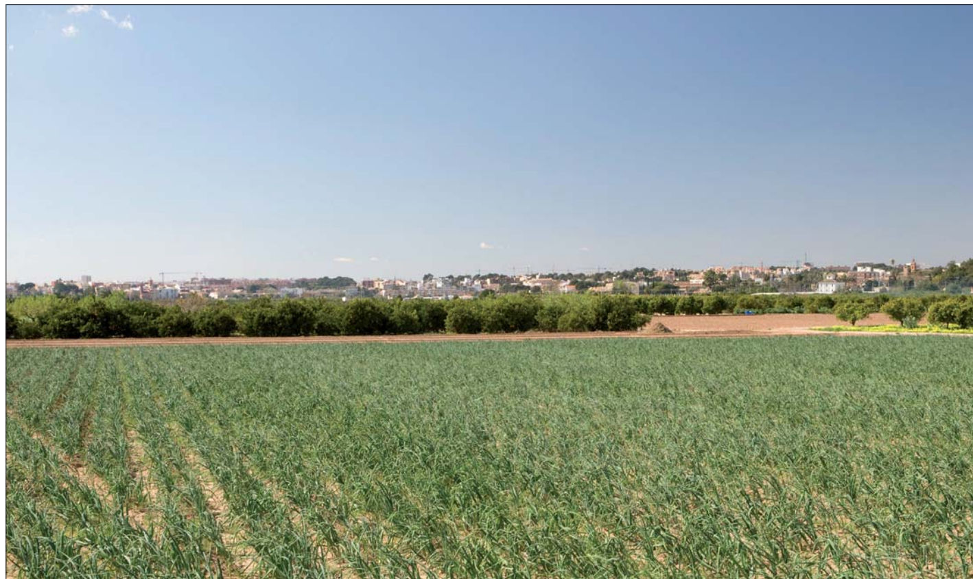
Imagen 02-16: Huerta del Arco de Moncada, y "balcón" poblacional al fondo