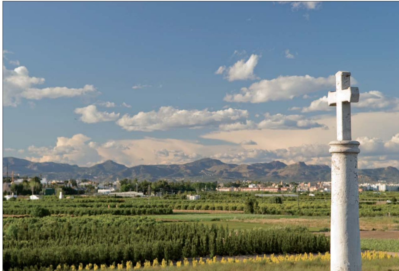
Imagen 02-10: Mirador a la huerta desde la Creu de Godella con el fondo escénico de la Serra Calderona