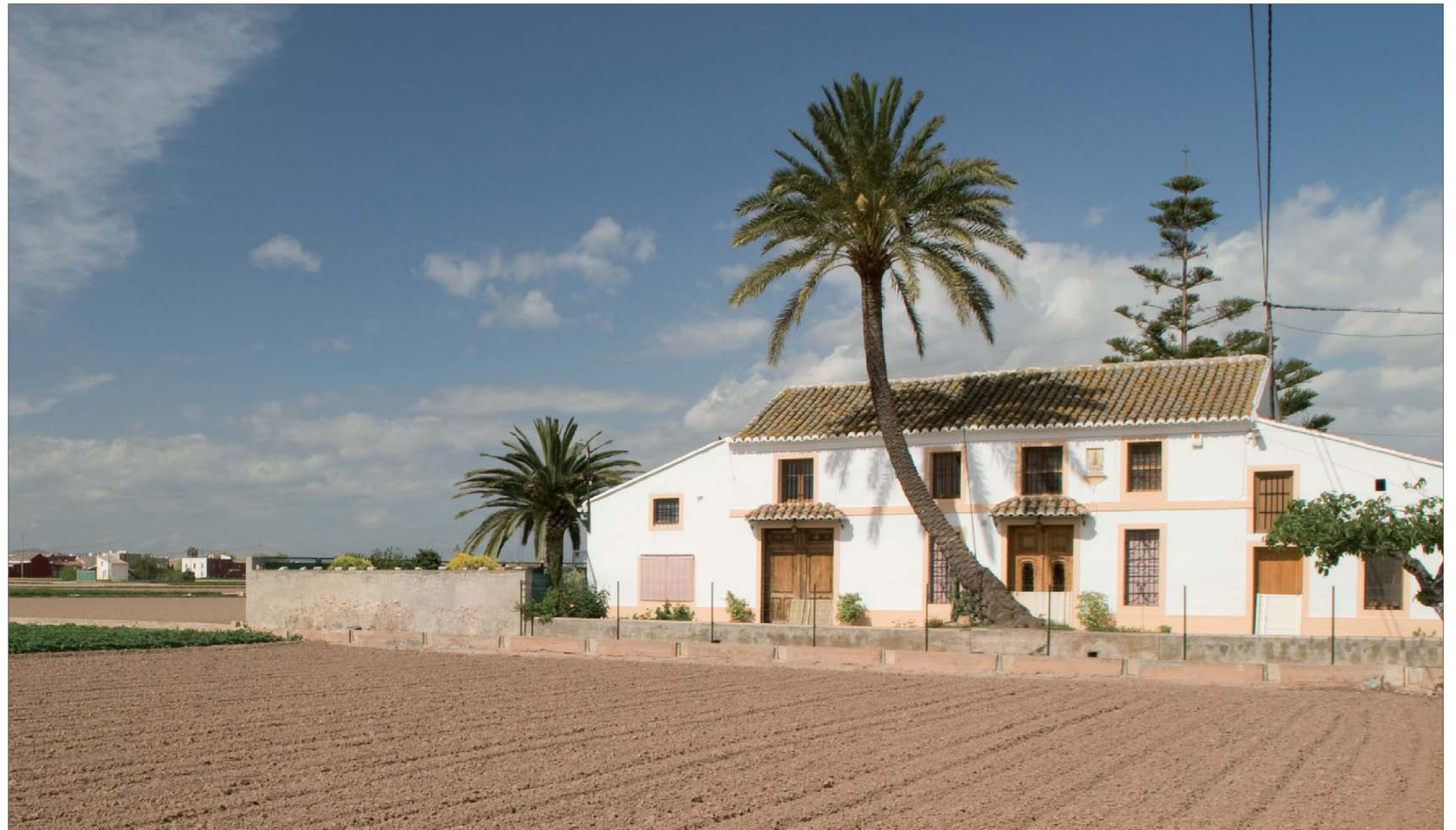
Imagen 02-08: Patrimonio arquitectónico como la alquería del Magistre, hidráulico como la acequia de Rascanya e histórico como el Camí Vell de Godella