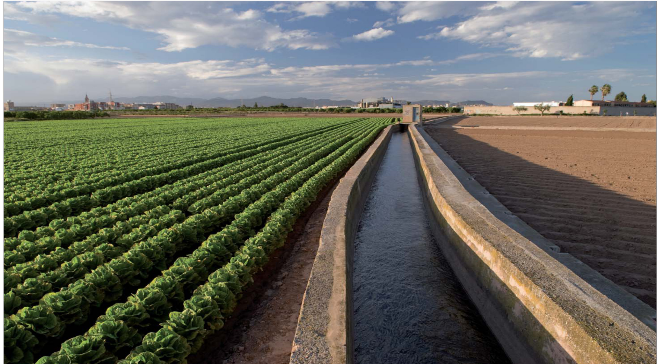
Imagen 02-09: Brazal de la acequia histórica Reial Sèquia de Moncada