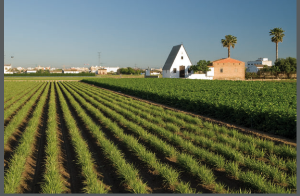
BARRACAS EN ALBORAYA