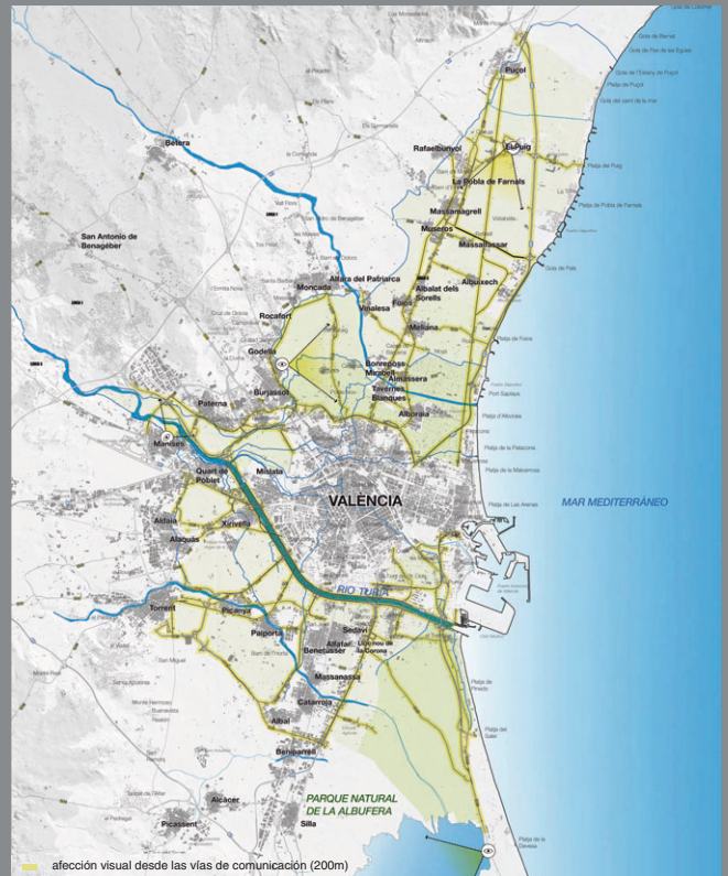
afección visual desde las vías de comunicación (200m)