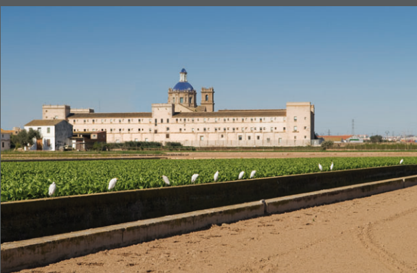
SAN MIGUEL DE LOS REYES