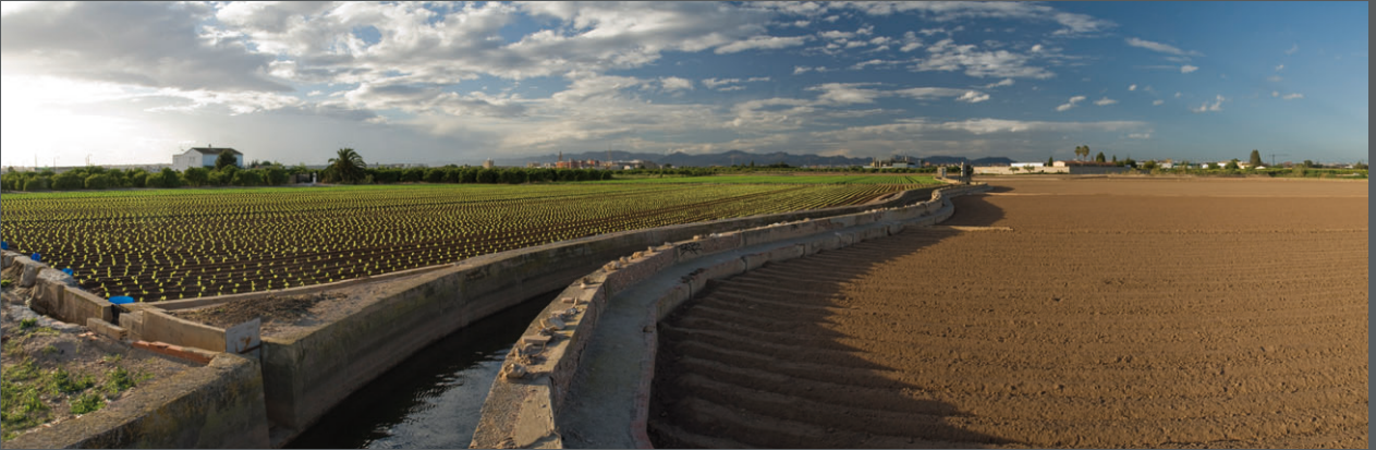
ESCENARIO VISUAL DE ALTO VALOR EN EL ARC DE MONCADA

Percibir para proteger: la percepción de la Huerta como espacio accesible y valioso, constituye un paso imprescindible para asegurar su protección. Por este motivo el Plan de Acción Territorial define las estrategias para mejorar el paisaje integral de la Huerta y para facilitar el acceso físico y visual a sus elementos o espacios de mayor interés, tanto desde los bordes urbanos e infraestructuras de transporte que la atraviesan, como desde la red de recorridos escénicos y miradores, que, apoyándose en el viario histórico existente, facilitarán su uso recreativo, didáctico y agrícola. Paralelamente se establecerán criterios para la integración de actuaciones que puedan afectar de forma directa o indirecta a la calidad del paisaje de la Huerta.