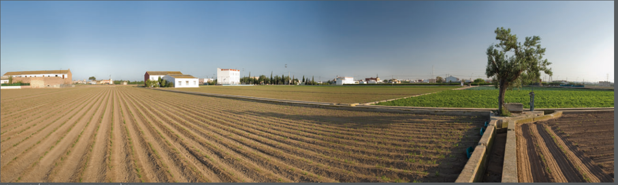
VISTA PANORÁMICA DE LA HUERTA DE ALMÀSSERA EN LA PARTIDA DE LA MAR

El Plan de Acción Territorial para la protección de la Huerta propondrá actuaciones dirigidas a la mejora integral del paisaje y a la creación de un sistema de recorridos escénicos y miradores desde los que apreciar los espacios o elementos de mayor interés.