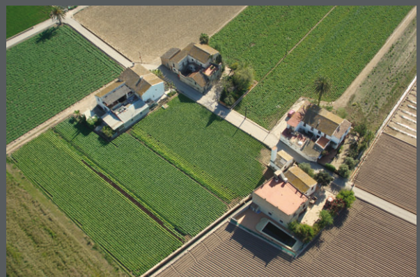
ARQUERÍAS EN L'HORTA NORD