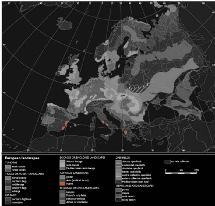
FIGURA 1-1: PAISAJES DE HUERTAS MEDITERRÁNEAS EXISTENTES

El paisaje de la Huerta de Valencia es un patrimonio histórico, cultural, natural y agrícola del pueblo valenciano. Es el resultado de una integración armoniosa del hombre con su entorno durante generaciones, y constituye un paisaje irremplazable con una personalidad única. Hoy en día, la huerta de Valencia está desapareciendo y se enfrenta a condiciones y cambios socioeconómicos que ponen en riesgo su supervivencia.