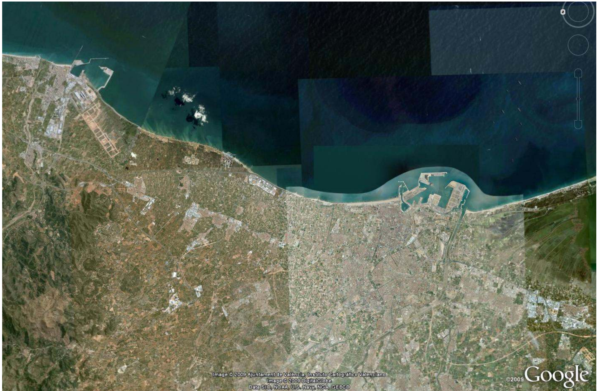
(1) Litoral desde Valencia a Sagunto mostrando las dársenas de ambos puertos