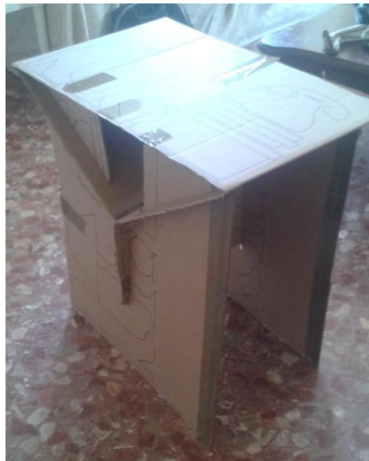
Mesa plegable en cartón

Manual de Instrucciones: Medir / Calcular /Cortar