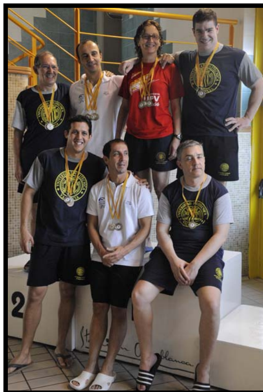
Representación Club Natación Master UPV