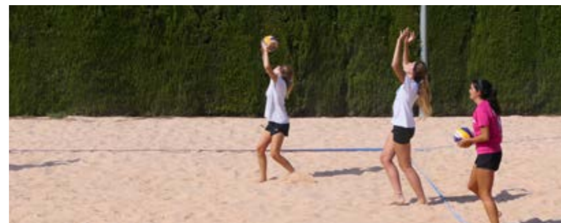
Voley - Playa

Martes de 19.00 a 20.30 Lugar: Edificio Trinquet UPV